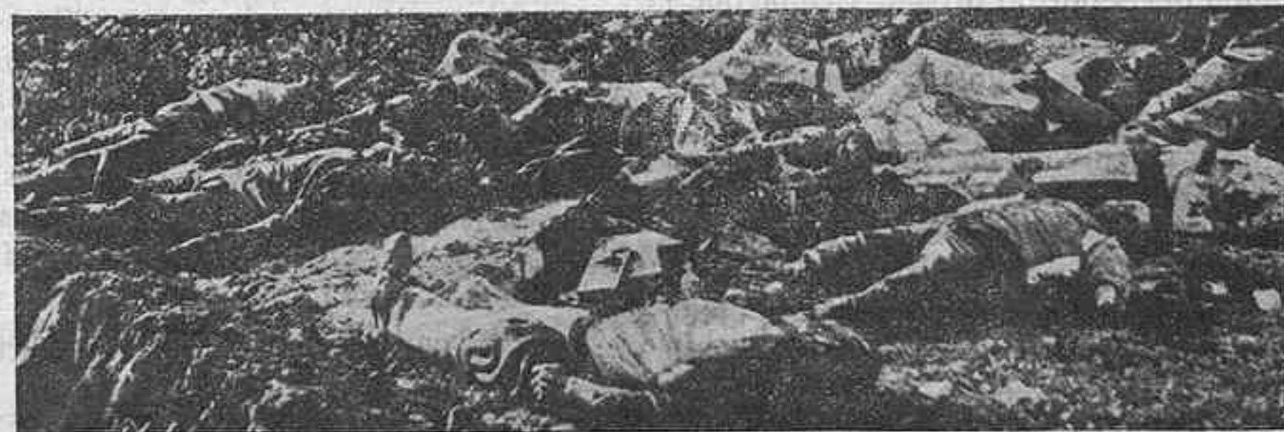
Esos despojos de los pobres inconscientes inmolados en Casas Viejas—espectros que nos hablan del horror del periodo azañista—señalan en estos días, con tantas otras víctimas de la marea revolucionaria, el límite infranqueable del fracaso de una política.

Frente a esas estampas pálidas y medio desdibujadas del niño rubio que ha sido príncipe y del hombre que por propia voluntad ha dejado toda aspiración al trono—acaso para que otro Príncipe mejor provisto de armas para la lucha pueda recoger la fe en un ideal en el que confiamos muchos españoles—está ese cuadro hiriente y tético de la tragedia de Casas Viejas, que gana de nuevo en estos días un primer plano de actualidad.—V.