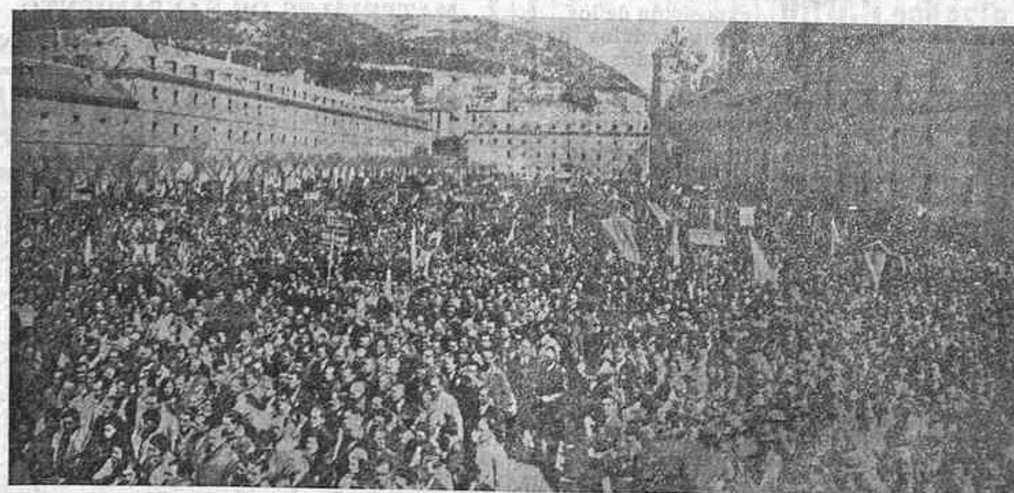
Imponente aspecto de la Lonja de El Escorial, al celebrarse la clausura del Congreso de las Juventudes de A. P.

Optica Covadonga Crucifijos - Cuadros religiosos - Gafas - Lentes San Bernardo, 37 — Gijón