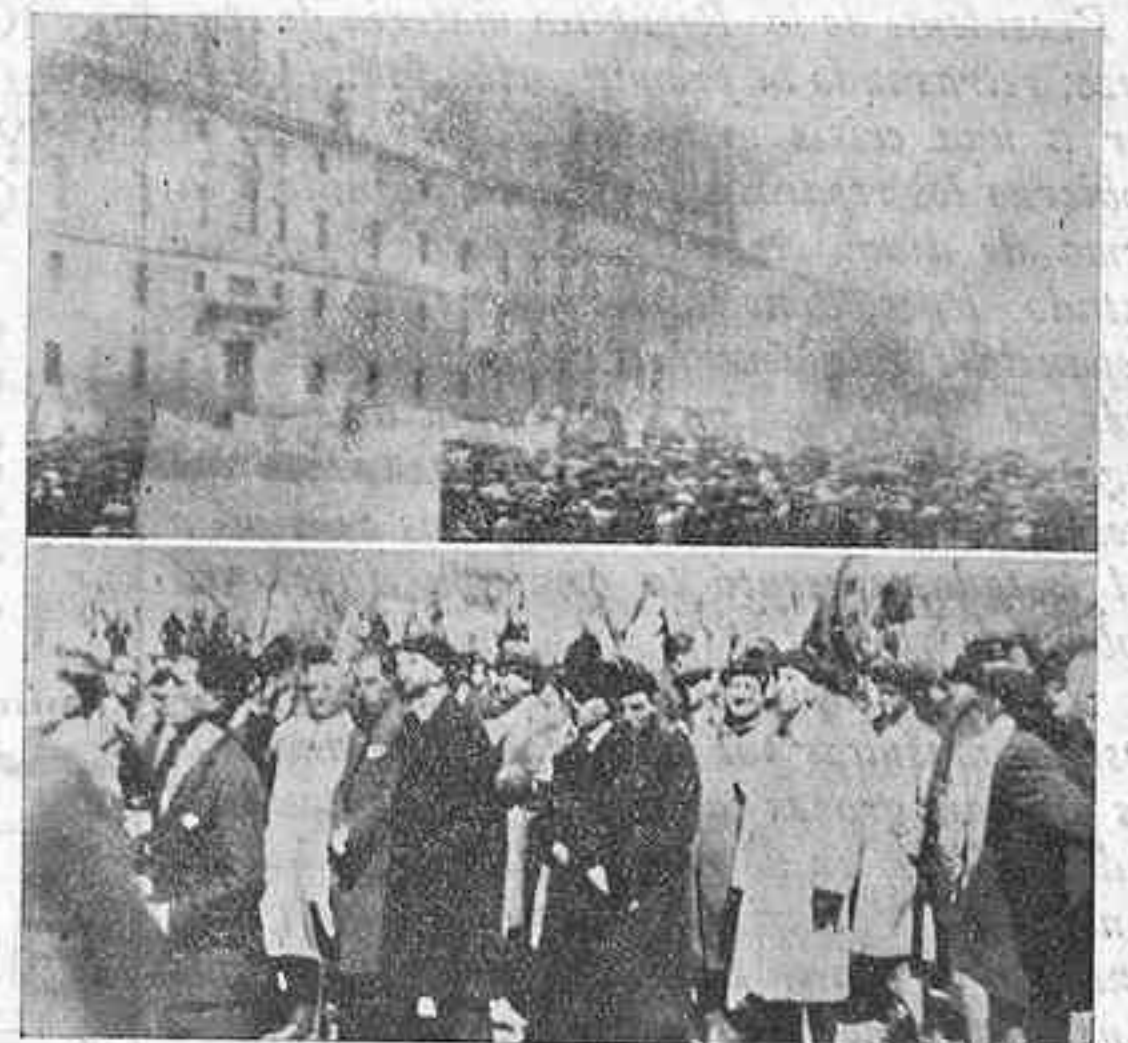
(Arriba): Los congresistas después de oír la lectura de las conclusiones en El Escorial, agitan los pañuelos, en señal de adhesión y de fervido entusiasmo.

Habiésemos querido compendiar en estas pocas líneas las impresiones del Congreso de la J. A. P. y la su solemne clausura en el Real Sitio de El Escorial, Quizá no hayamos podido plasmar en el papel los diversos sentimientos que estos días hemos experimentado, porque fue tan grandioso todo, tan lleno de emociones, tan pleno de entusiasmo y majestad que fuera preciso otra pluma para reflejar esto, si quiera sea en forma escueta.