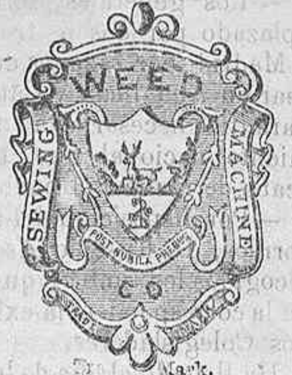
Without which none are genuine.

El representante de dicha compañía, informado que su encargado no ha contentado las personas que compraron sus máquinas, acaba de llegar espresamente á esta. Suplica á todos los que encuentren dudas ó dificultades, en el uso de sus máquinas, pueden dirigirse á él en la fonda de la Iberia. Teniendo un surtido de máquinas en esta, y tratando de dejar un depósito en Oviedo, pueden aprovecharse de mi permanencia en esta.