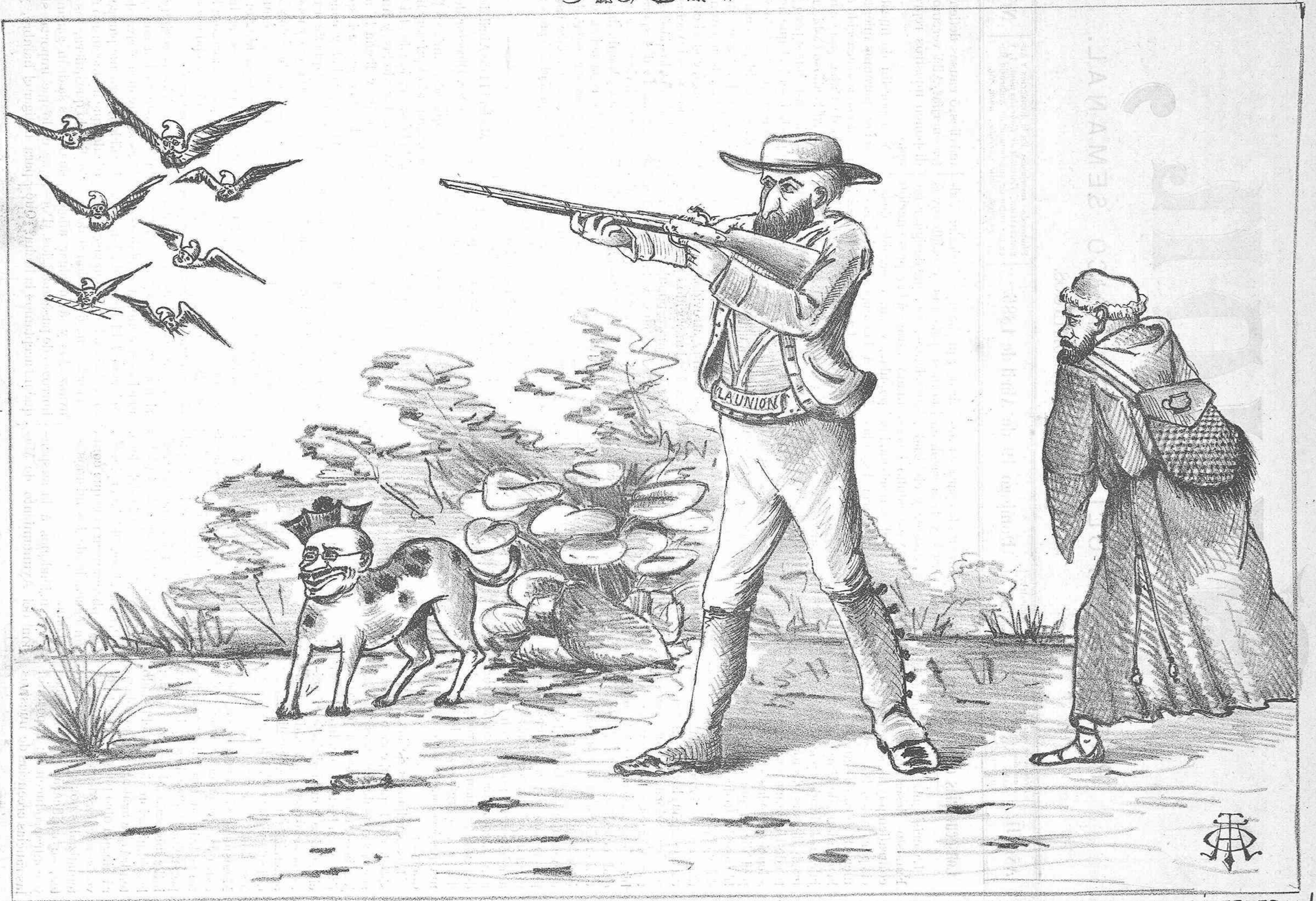
ANTES LO HACIA MUY MAL - PUES HOY CON MEJORES VIENTOS - SOLO CAZA DEL MORR AL - DIGO.....; SERA FEDERAL!