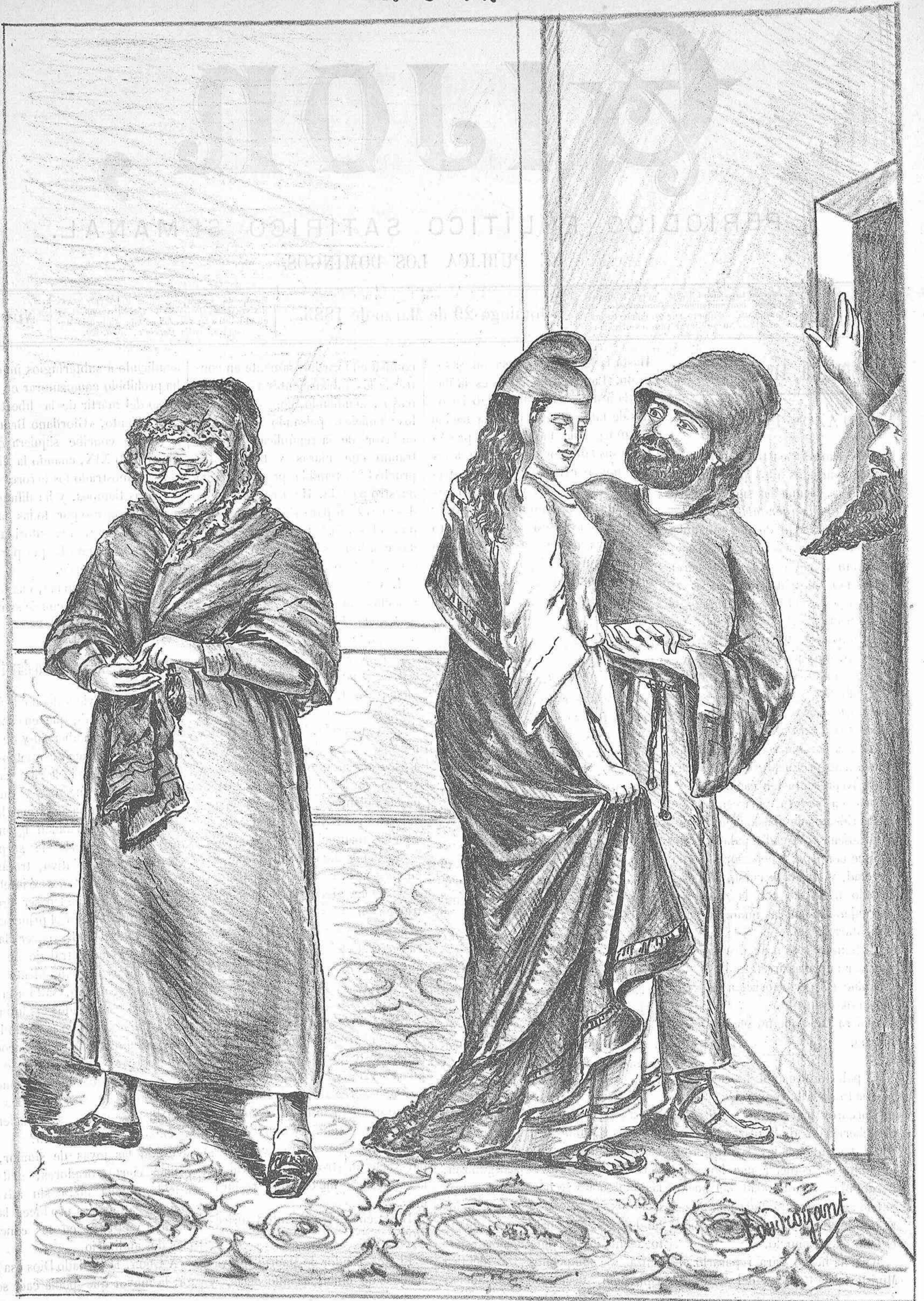
LA NIÑA ES MUY INOCENTE—Y ES CLARO! NO ENTIENDE NADA... EL NEGOCIO NO ES DECENTE,—PERO YO HICE LA JUGADA.