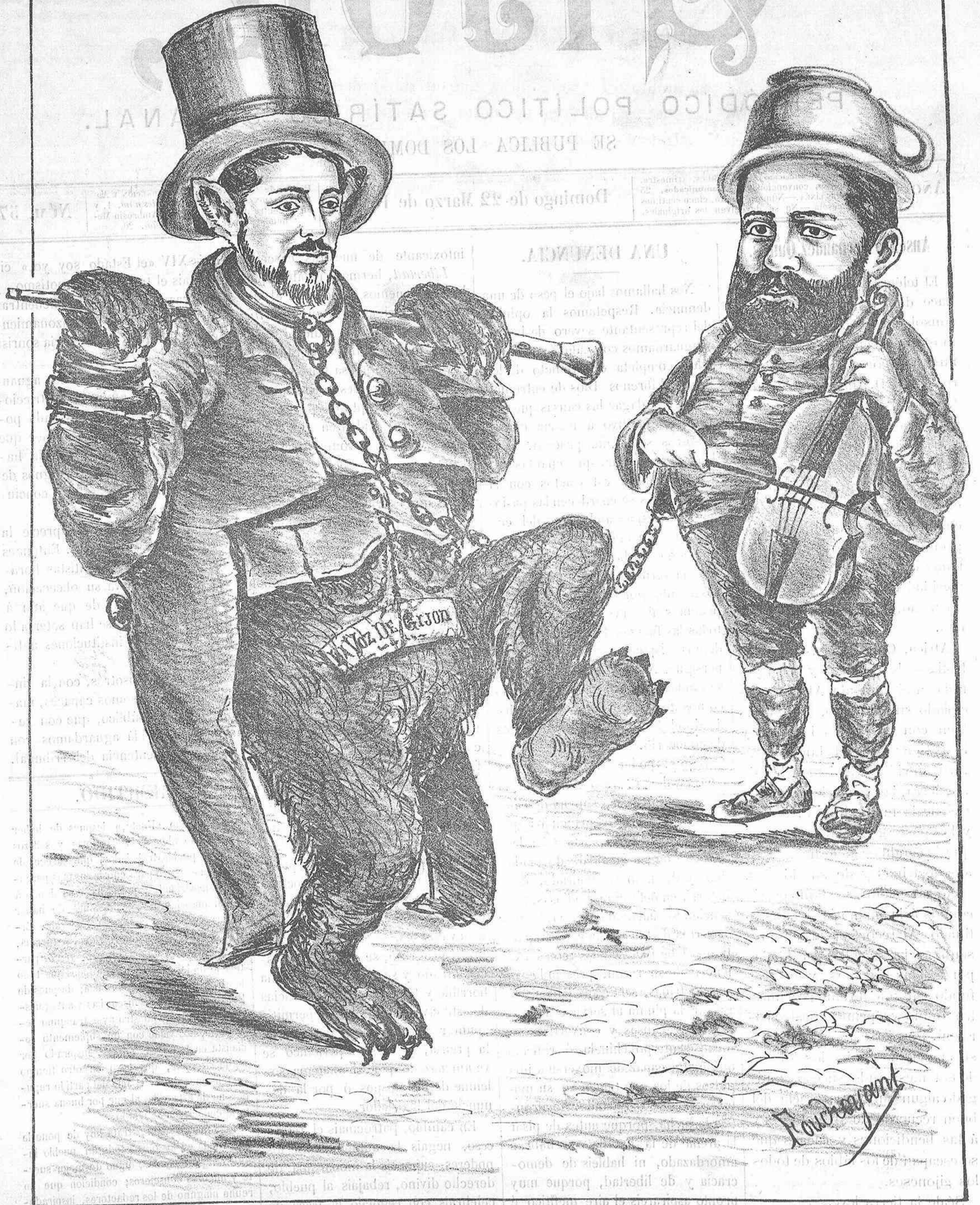
DE FIGURAR EL EMPEÑO, - HA TRAIÑO Á ESTE ESTADO A UN DOCTOR... Y A UN DERROTADO - EN LA ELECCION DE... CARREÑO.