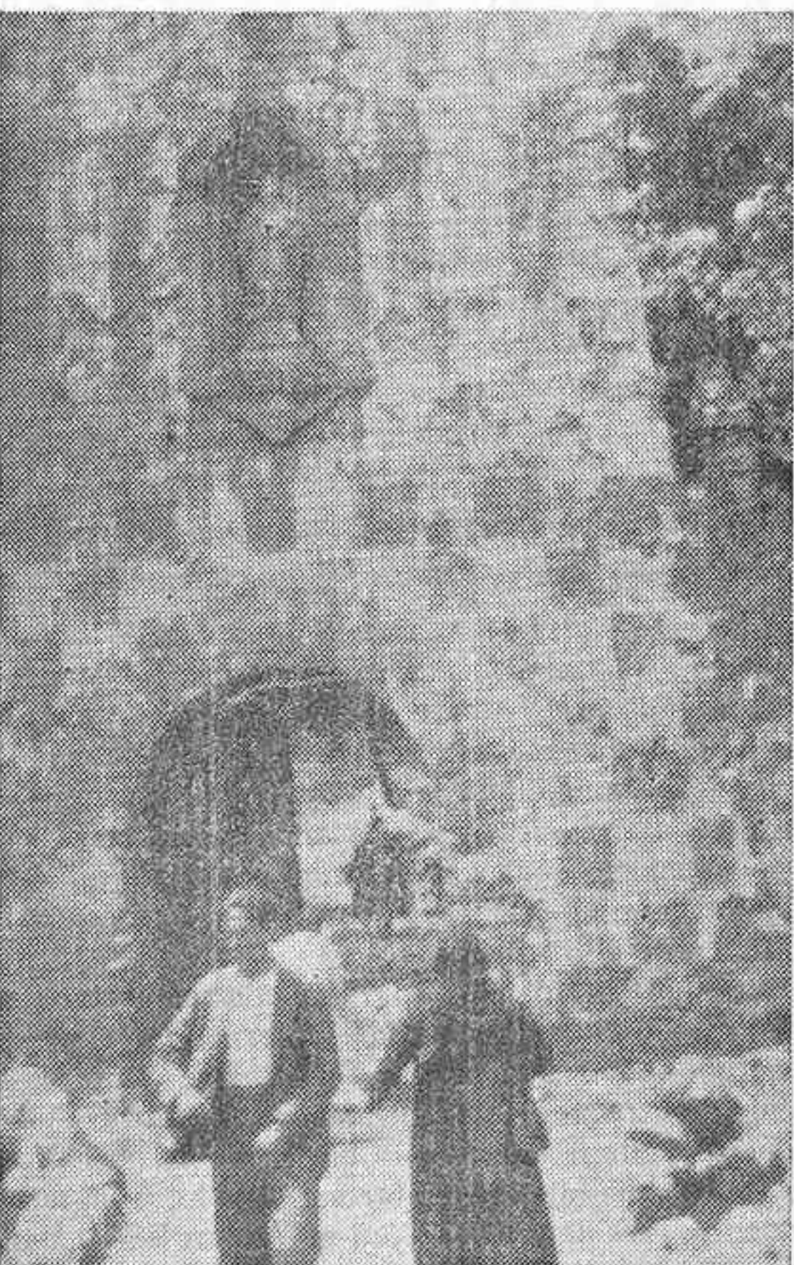
Magnífica fachada del Santuario de las Batuecas.

Uno por uno fuimos pasando ante dos policías, venidos expresos de la capital, siendo leídos cuantos documentos llevá-