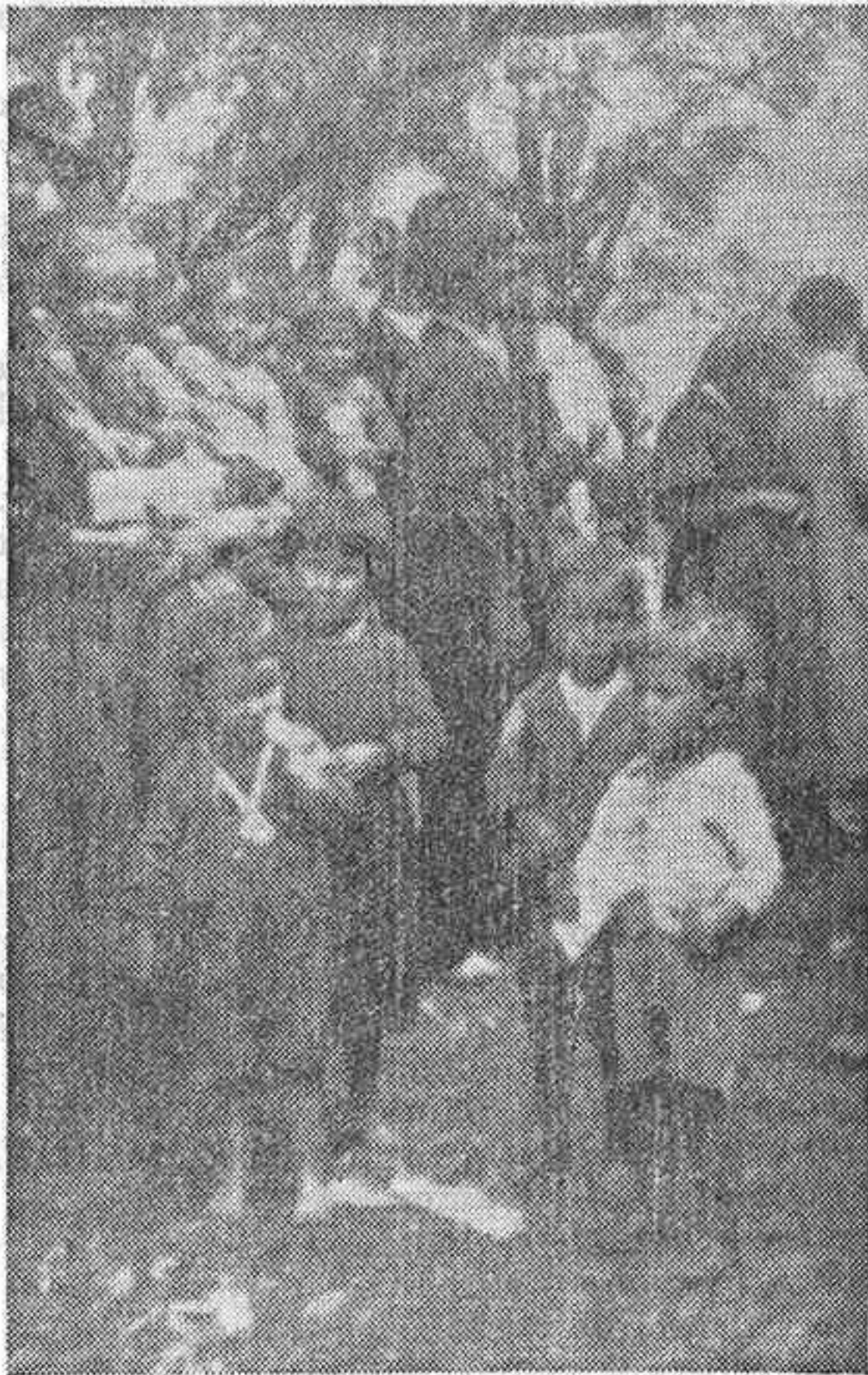
Grupo de niños hurdanos.

Síntoma deprimente de estos tiempos—como decimos al principio—en los que el patriotismo, el desinterés y la abnega-