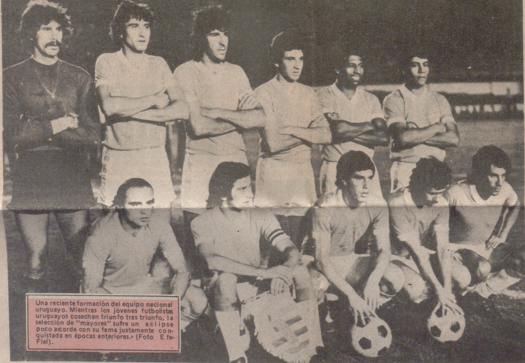
Una reciente formación del equipo nacional uruguayo. Mientras los jóvenes futbolistas uruguayos cosechan triunfo tras triunfo, la selección de “mayores” sufre un eclipse poco acorde con su fama justamente conquistada en épocas anteriores.

—Estas magnificas instalaciones comerciales que acabas de inaugurar “Studio Violeta, ¿significan quizá tu adiós definitivo al fútbol activo? —Pienso que no. La verdad es que no me gusta hacer el ridículo, pero creo haber demostrado, jugando de medio volante, que todavía puedo aportar bastante de positivo al equipo de mi tierra. —¿Y suponiendo que sea la Junta Directiva quien te dega adiós? —Lo lamentaré profundamente, porque no estoy acabado, ni mucho menos. De todas formas son ellos quienes mandan y deciden. Lo aceptaré todo, como hice siempre, aunque en este caso particular no me gusta. —Se habla de brindarte un partido homenaje como despedida, ¿suficiente para un hombre que ha entregado a su club lo mejor de si mismo? —Sí, suficiente. Llegué discretamente al Zaragoza, cual corresponde a mi forma de ser, y si ahora me marcho, quiero hacerlo de la misma manera. —Si te ofreciesen un cargo técnico, ¿cual sería tu postura? —Lo aceptaría con agrado, siempre y cuando pudiese aplicar en beneficios de los demás lo que yo he aprendido en tantos años de futbolista. Para ser un monigote, ni hablar. Con mi experiencia pienso que puedo aportar algo en beneficio de los colores que siempre he defendido. —¿Qué ha significado Violeta para el Real Zaragoza?