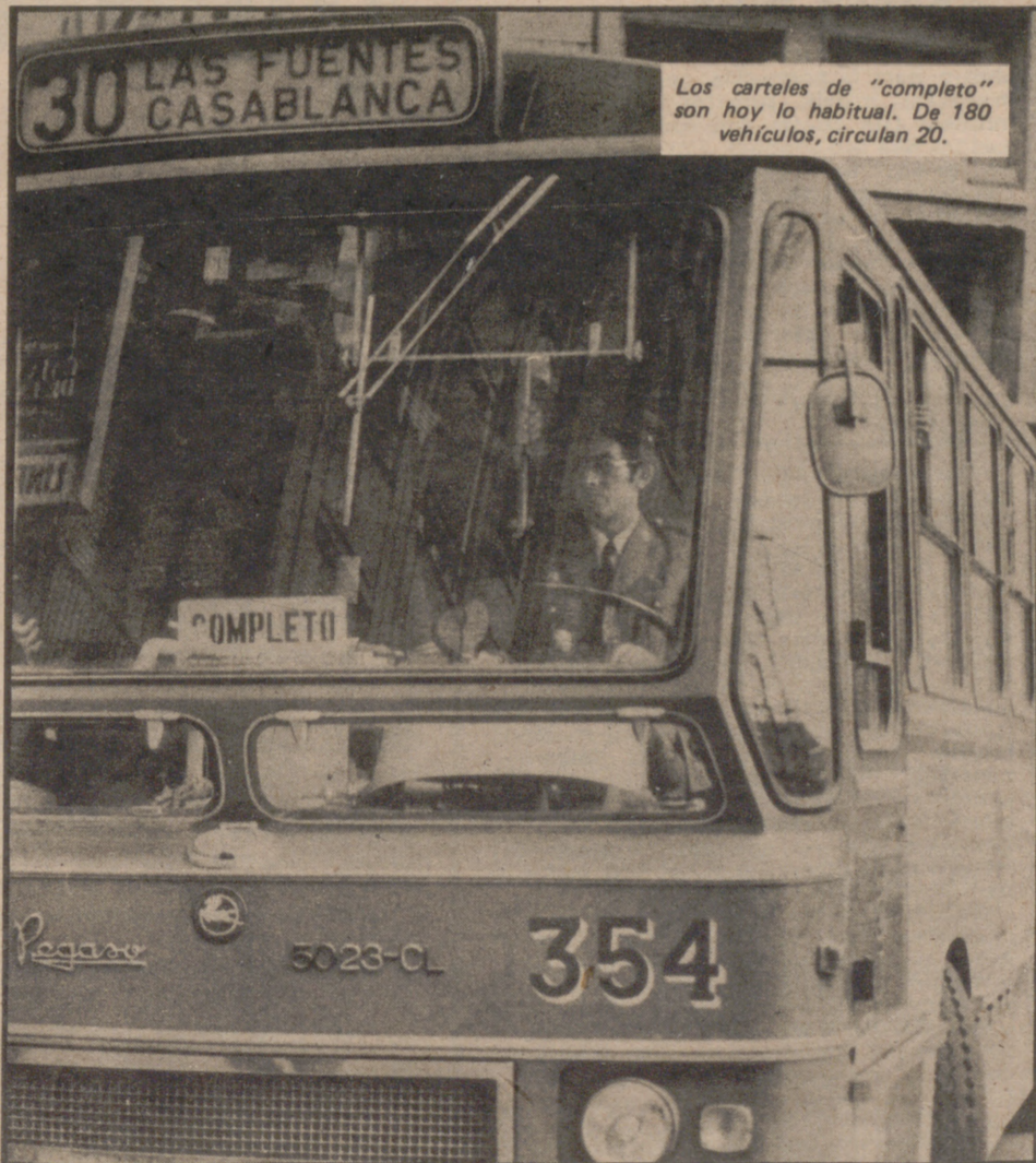
Los carteles de "completo" son hoy lo habitual. De 180 vehículos, circulan 20.