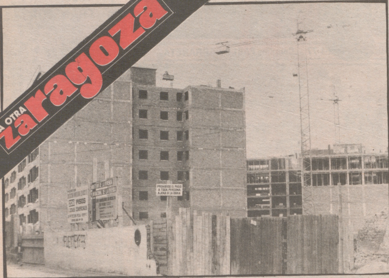
Las casas de los aljibes