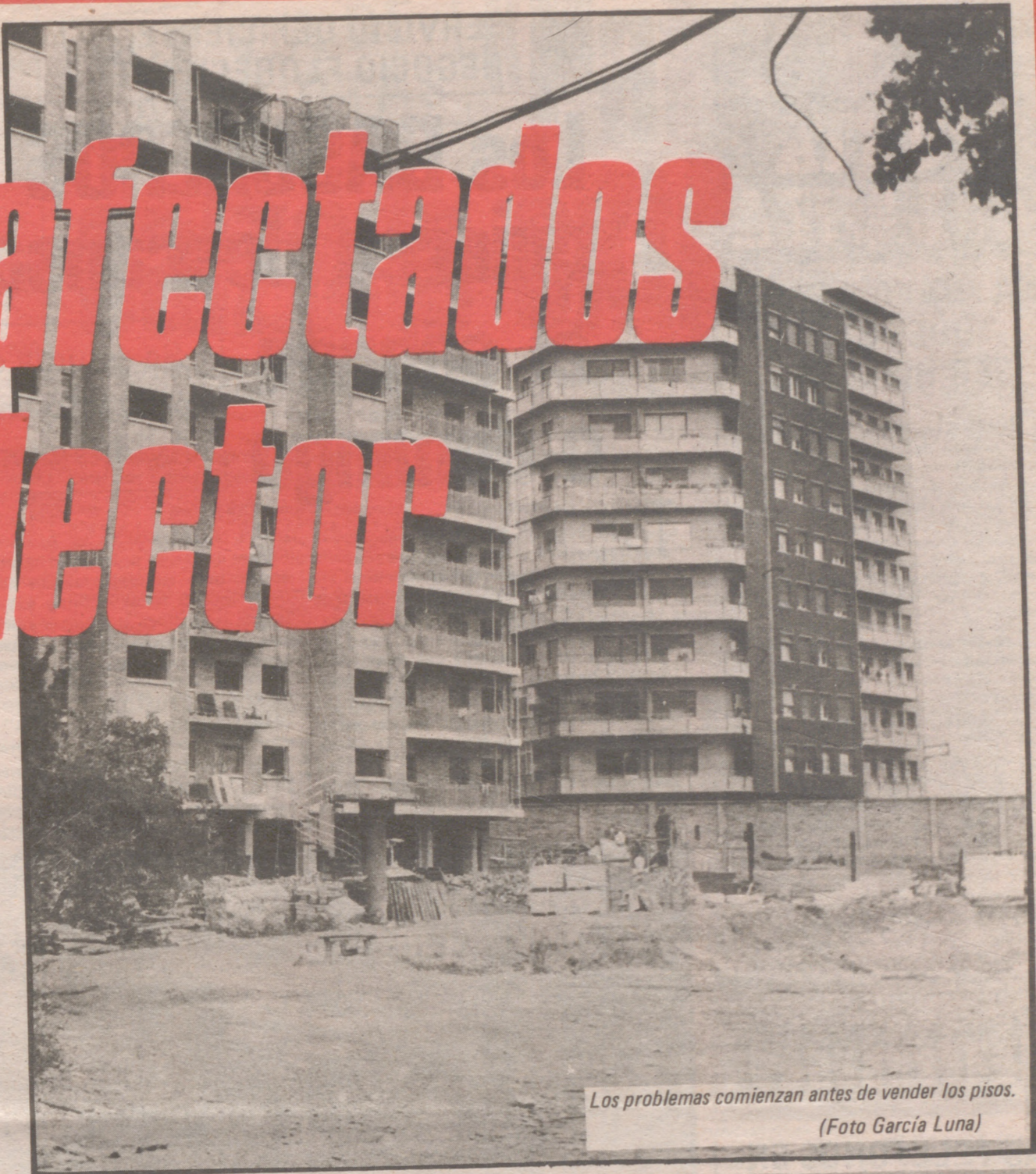
Los problemas comienzan antes de vender los pisos.

Al parecer, si no cambian los planes municipales, no estaría en uso hasta dentro de al menos diez años. —El problema no es sólo de los que van a vivir en estos pisos en construcción, sino de todo el sector. Los vecinos de la Parcelación Barcelona o de la calle Galán Bergua temen las lluvias y las tormentas, porque acarrearán automáticamente verdaderas inundaciones.