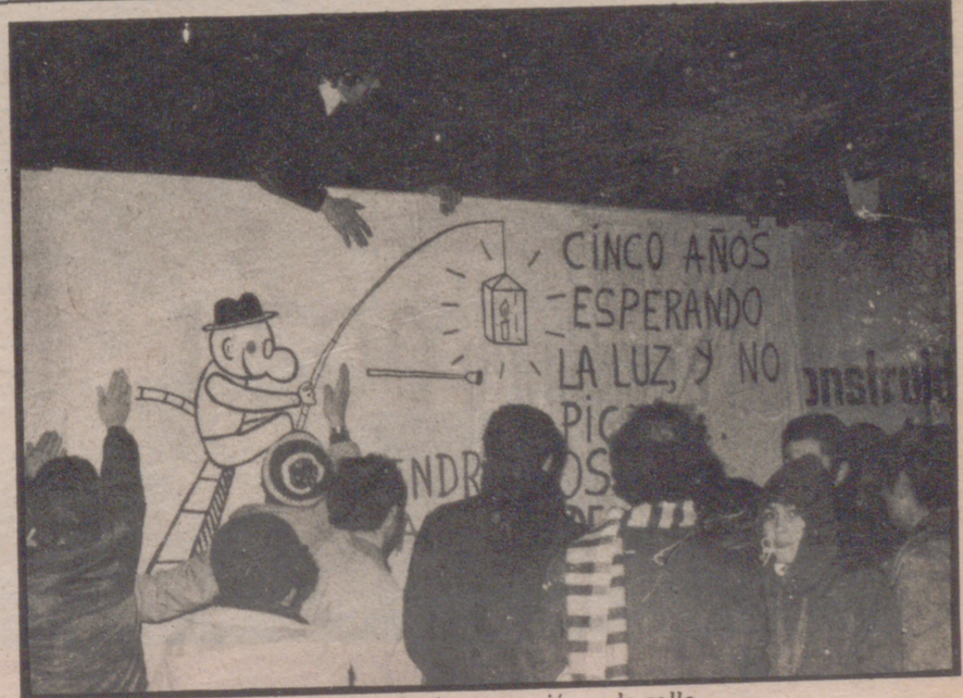
La inauguración, a la calle

Los que se frotan las manos son los vecinos del polígono Ebro Viejo, que conocen perfectamente el alcance de este proyecto. Nada de petachos. Un total de casi 45 millones serán invertidos por el Ministerio de la Vivienda en reparar lo que hace doce años