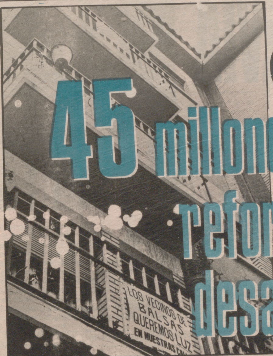
Mil carteles en todos los balcones

Año I - N.º 10 - ESPECIAL BARRIOS DE A/e - 30-12-76 - Coordina: PABLO LARRAÑETA