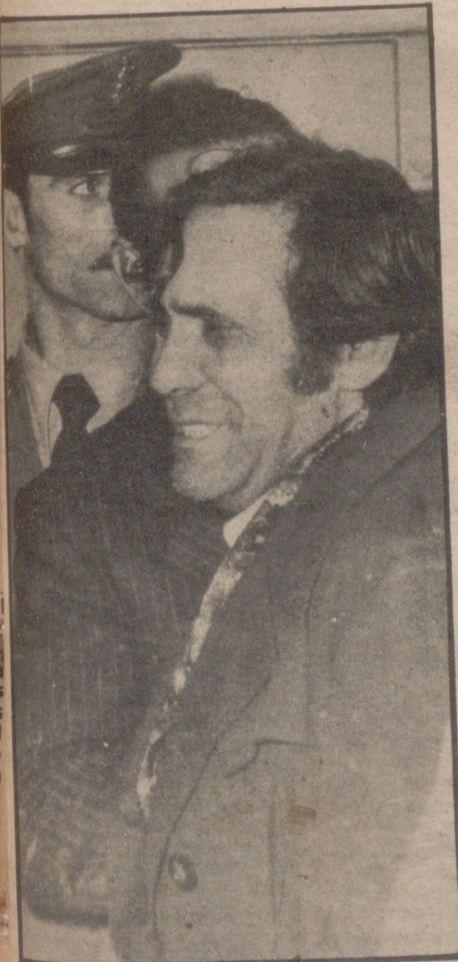
El abuelo de los tres pequeños llora al llegar junto a la furgoneta que trasladaría los cadáveres

ZARAGOZA, 30 (ARAGON/express).— Tres niños de 6, 4 y 2 años de edad han perecido carbonizados mientras se hallaban durmiendo sobre las diez y cuarto de la mañana de hoy. El dramático suceso se ha producido en el tercer piso del número 26 de la calle de San Agustín, a consecuencia de un incendio que únicamente ha afectado al dormitorio donde se hallaban los tres pequeños, de raza gitana.