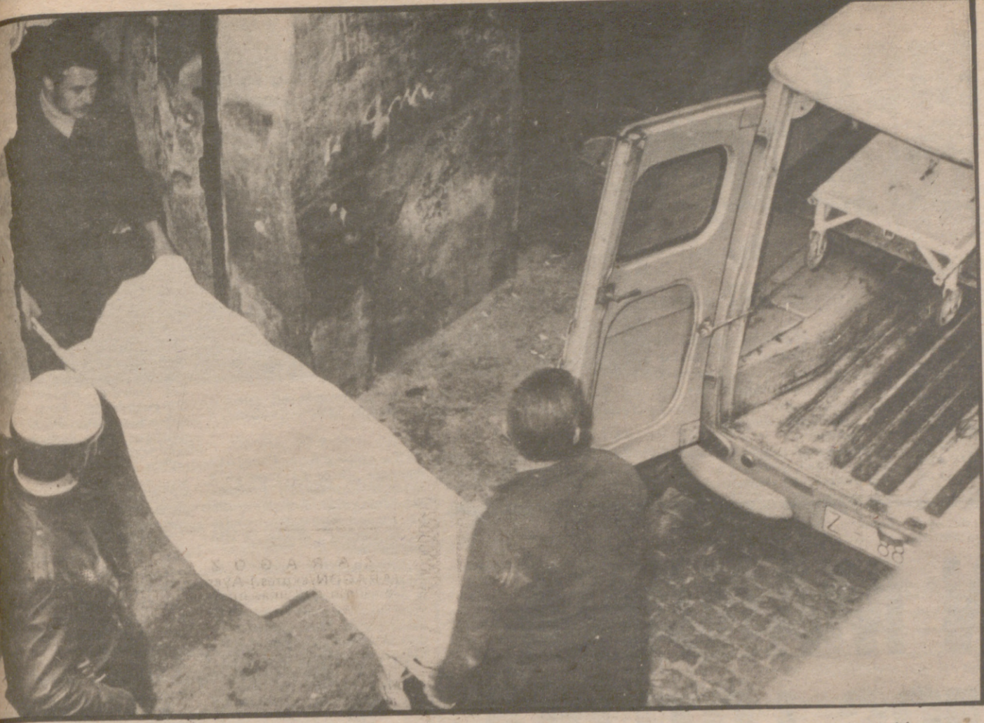
Los tres cuerpos —abrazados— cabían en una sola camilla

Don Fernando Ordóñez, miembro de la comisión asesora de la oposición del Gobierno informó, al momento de los puntos a tratar el día 13, sobre las próximas elecciones: Listas abiertas o cerradas; circunscripciones provinciales o regionales; colegios electorales o nacionales; elección interna (pública o privada) y sistema de votación y control de las elecciones.