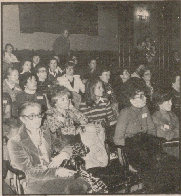
CONGRESO INTERNACIONAL DE MUJERES JURISTAS

MURCIA, 14 (Logos).— Soy de los que creen que en estos momentos el país nos pide a todos confianza en nosotros mismos: generosidad para construir