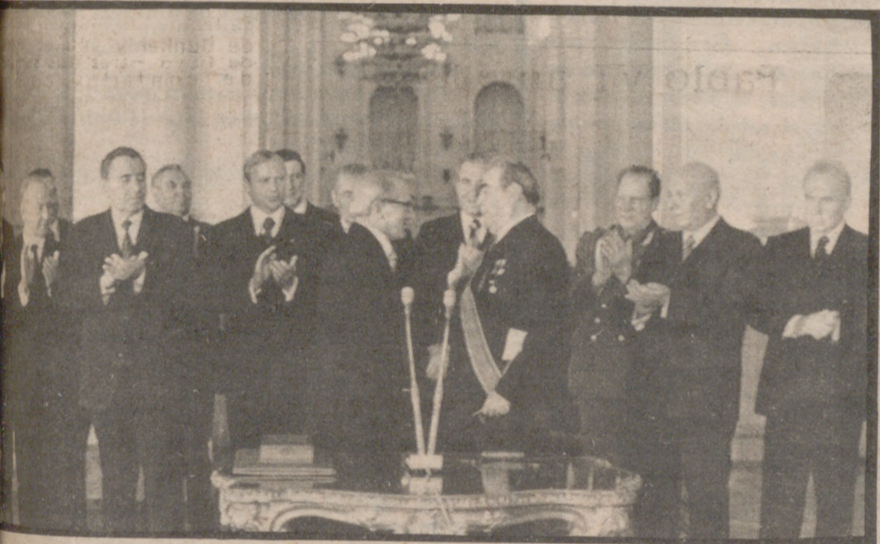
CONDECORACIONES PARA BREZNEV

La secretaria general de la Administración concluye su comunicado negando "las versiones que gente interesada en sembrar el desconcierto ha estado emitiendo para confundir a la ciudadanía", y reafirma una vez más que "no han existido disonancias en el seno de las fuerzas armadas y menos aún dentro del rango de generales de la República".