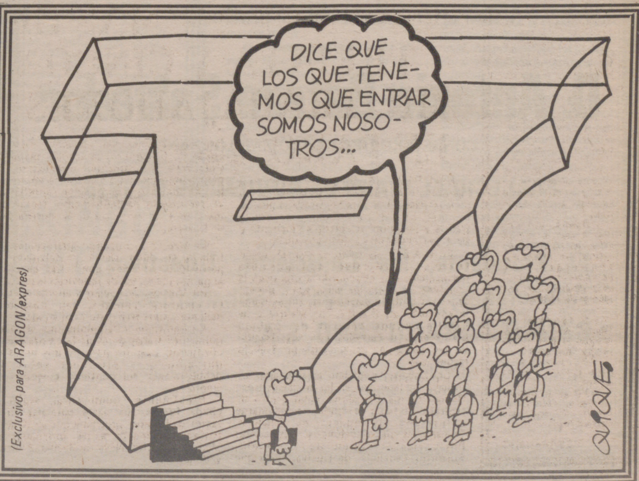
(Exclusivo para ARAGON/express)

"Esta coordinadora provincial vuelve a insistir en que el magisterio granadino no quiere privilegios sino justicia".