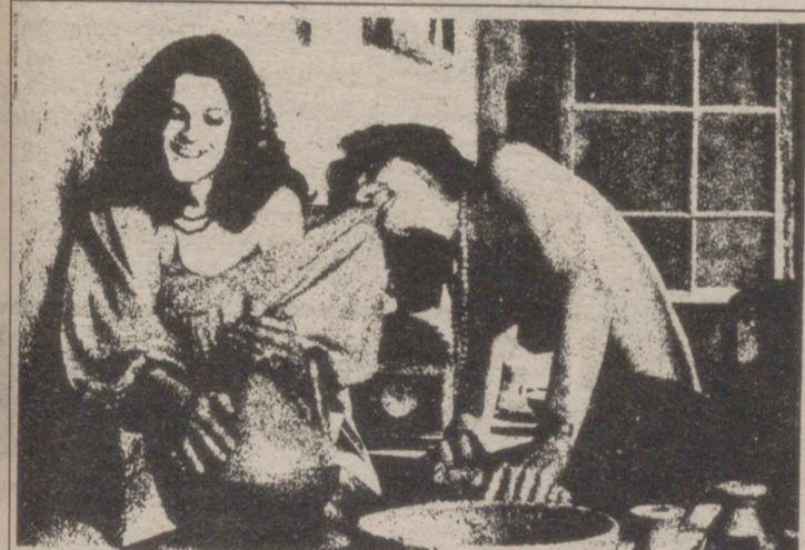
No fue sólo mirarse juntando las manos. Por eso quedó mordida de oro la desnudez de sus dedos.