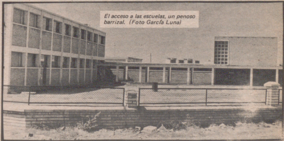
El acceso a las escuelas, un penoso barrizal.

Muchos otros problemas han urgido al nacimiento de la Asociación «El Puente-Santa Isabel». Los promotores confían que mañana, a las ocho de la tarde, el salón de la parroquia —el único que existe en el barrio— se abarrote de vecinos.