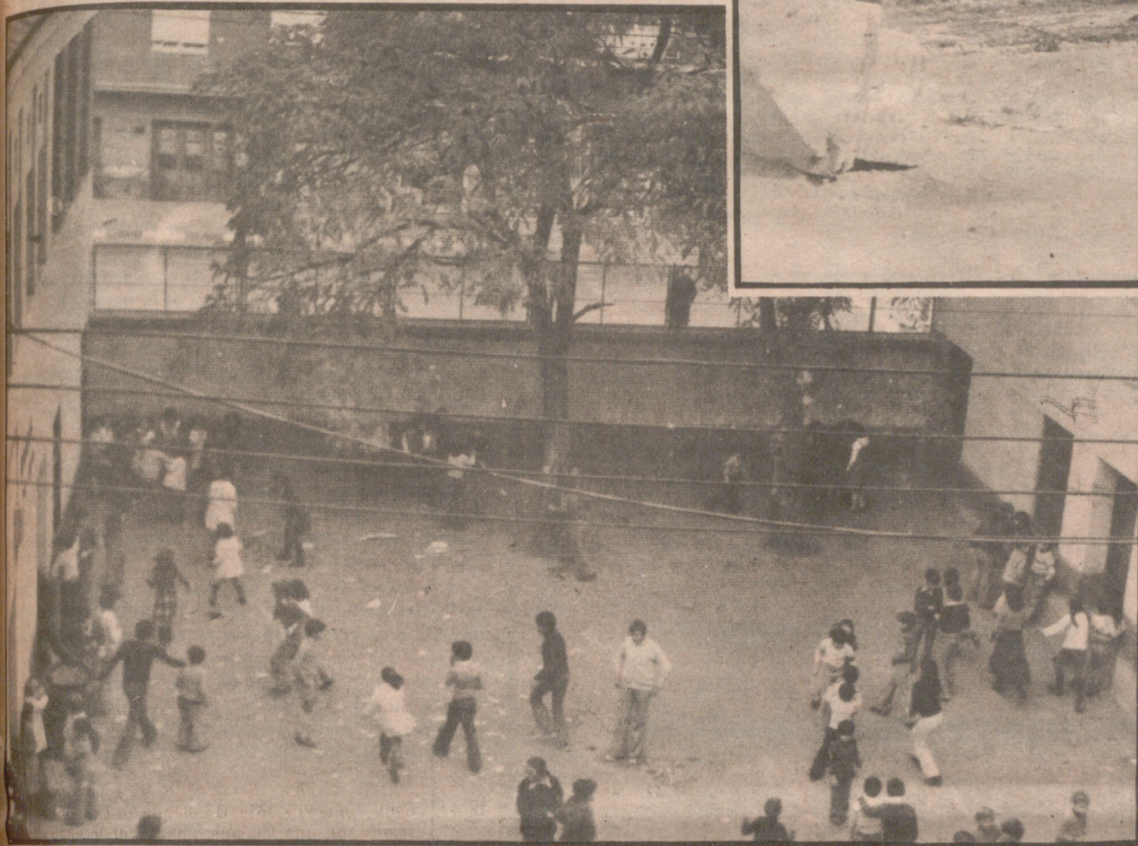
El minúsculo patio del "Calixto Ariño" se cierra a la calle con una puerta de poco más de un metro.

EL barrio de San José está consiguiendo un nuevo colegio a pulso. Más de 50 padres de alumnos del decrepito colegio de "Calixto Ariño-Mariano de Cavia" han tomado en sus manos las gestiones para conseguir que el barrio cuente con nuevas dotaciones escolares, dignas de ese nombre. Y, hasta la fecha, sus idas y venidas están dando buen resultado.