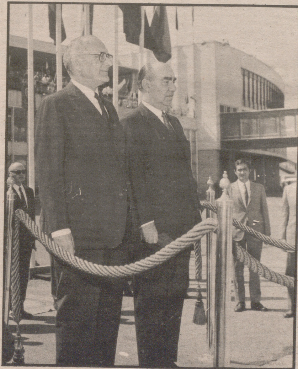
Caetano con Carrero Blanco, durante una visita a España

que luego se quedaron en nada para lo que prometían, parecía y se esperaba. Quiere también Carter pleno establecimiento de relaciones diplomáticas con la República Popular China y tratará —esto ha dicho al menos el futuro jefe de la más importante potencia política, militar y económica del mundo— de establecer una mayor cooperación con los países del Tercer Mundo. Algunos observadores y comentaristas señalan también la posibilidad de una postura más flexible en las relaciones con los aliados, apoyo incondicional a Israel y todo el empeño del nuevo equipo por conseguir en el Africa Austral —donde Norteamérica está saliendo tan mal parada— gobiernos muy moderados para Rhodesia y Africa del Sur. La verdad es que la cosa va a ser difícil si tenemos en cuenta las declaraciones de los cuatro presidentes africanos más importantes (Tanzania, Zambia, Angola, Mozambique y Botswana) al manifestar públicamente y