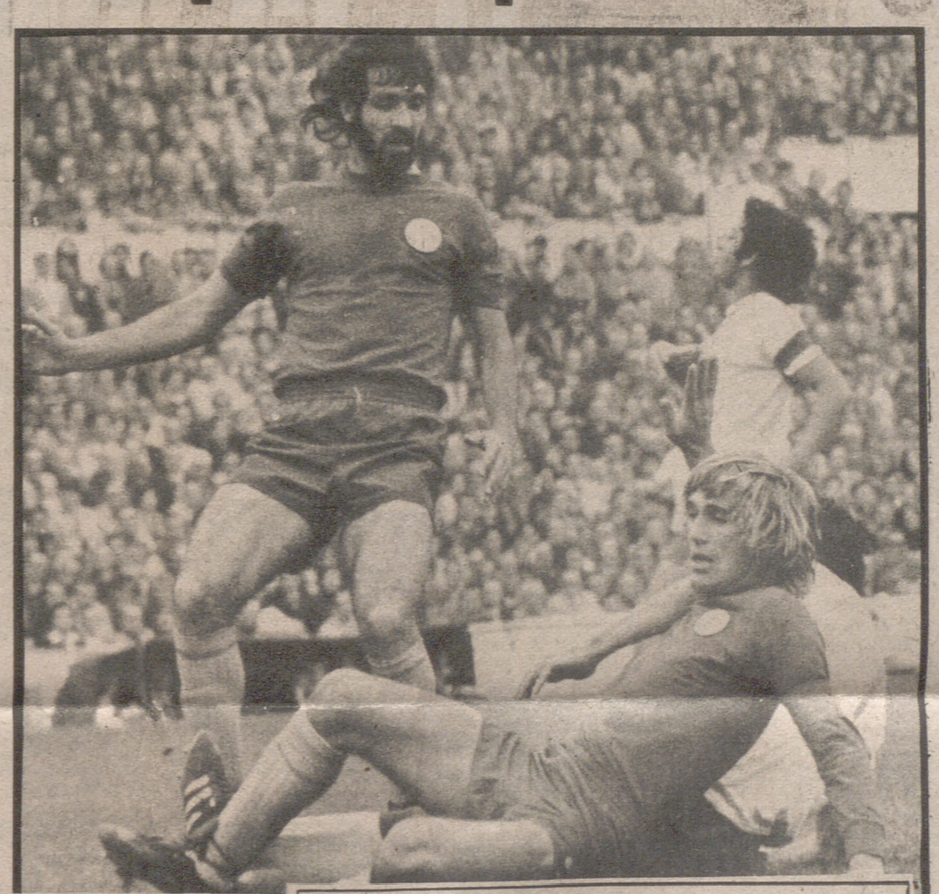
¡QUE DULCE ERA MI PRADO... EN SALAMANCA!