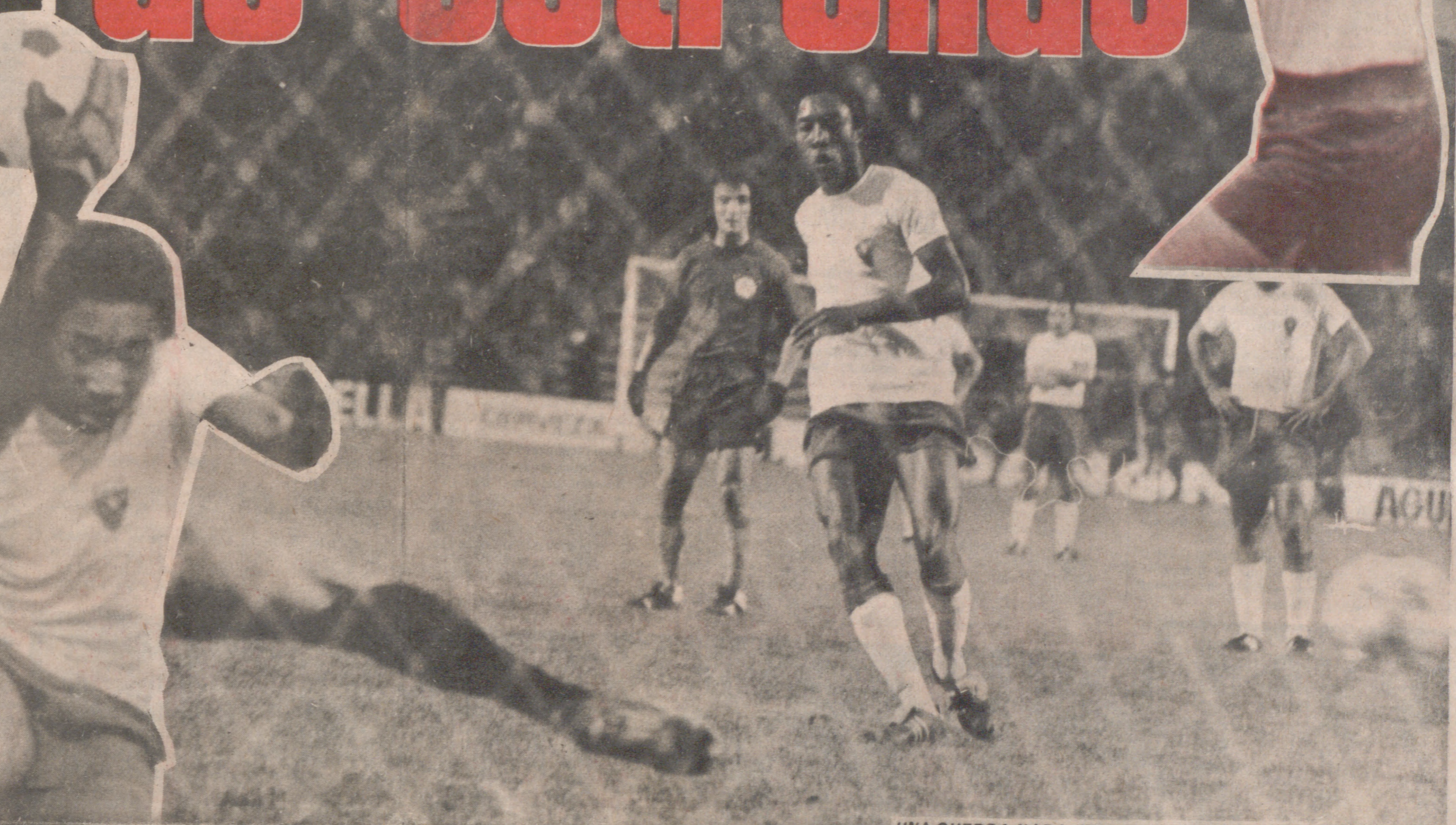
UNA GUERRA NADA "FRÍA": LA DEL PENALTY