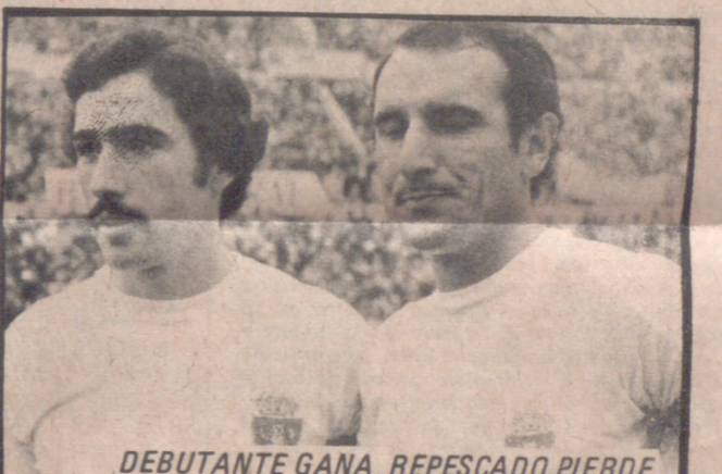
DEBUTANTE GANA, REPESCAO PIERDE