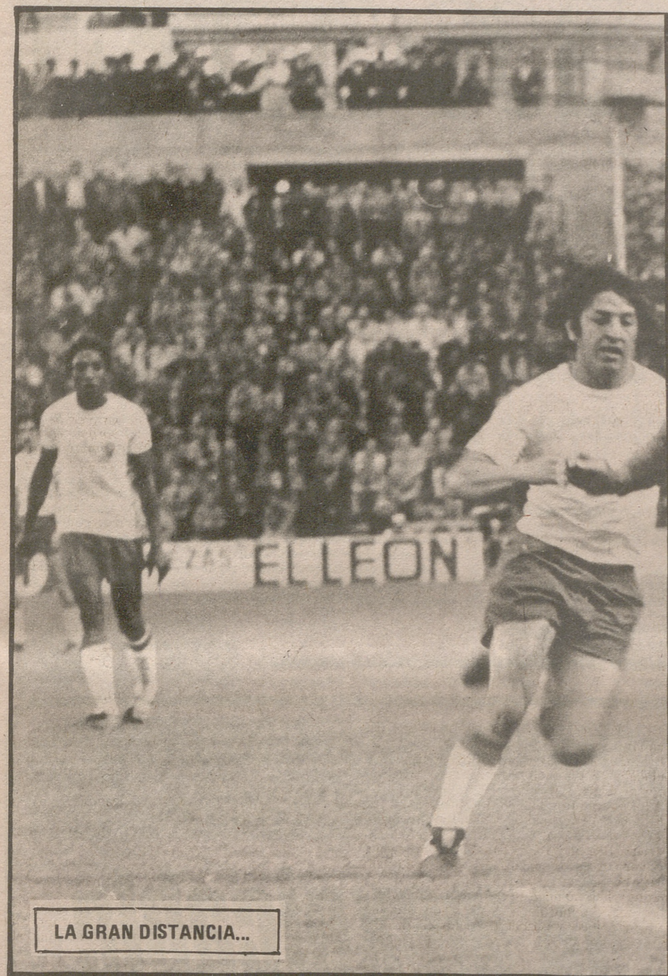
LA GRAN DISTANCIA...