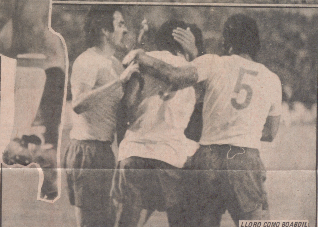
LLORO COMO BOABDIL