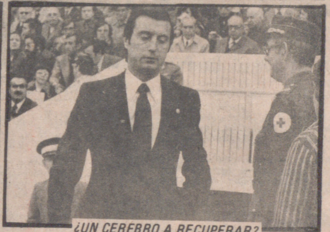
¿UN CEREBRO A RECUPERAR?