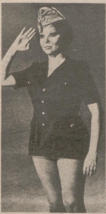
A Marujita Díaz, por su "genialidad" sabatina de "Música y estrellas", van a nombrarla Madrina de Honor de todos los Hogares de Jubilados del país. Es que a los abuelitos les está quitando años y años de encima. Como que alguno hasta se "cachondea"...