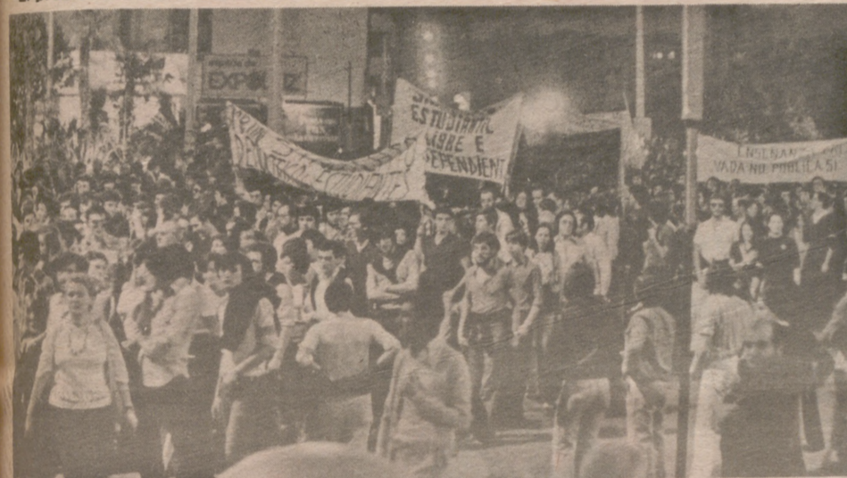
Parada en la Plaza de Paraíso

Digamos que al frente de la manifestación, entre los jóvenes que formaban su cabeza y marcaban su evolución, se encontraba el padre del universitario que recientemente fue objeto de una intervención quirúrgica realmente seria en la que se utilizó la sangre donada desinteresadamente por una veintena de compañeros suyos. Quizá el joven enfermo hubiera querido estar presente en esta manifestación estudiantil, y su padre decidió acudir a ella para representarle.