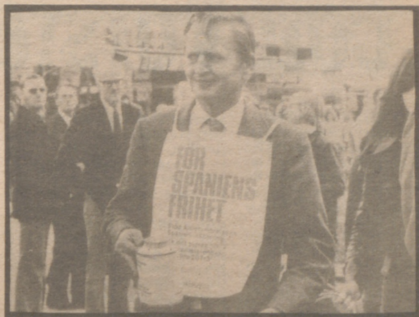
Olof Palme, durante una cuestación en Estocolmo en favor de la oposición española

Suecia se ha convencido de que tras cuarenta y cuatro años de Gobierno socialista ha llegado la hora del cambio. Aquí la socialdemocracia, que es el "establishment", ha dispuesto de más dinero y de más voluntarios para apoyar la campaña que los tres partidos