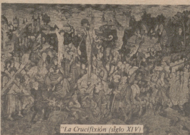
"La Crucifixión" (siglo XIV)

EN qué estadio se encuentra la proyectada construcción del nuevo Museo de Tapices de La Seo? Cómo es sabido el actual está ubicado en unas dependencias contiguas al templo.