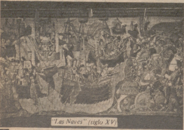
"Las Naves" (siglo XV)

● La colección es una de las más importantes de Europa. El más famoso, el tapiz de "Las Naves", ejemplar único en el mundo.