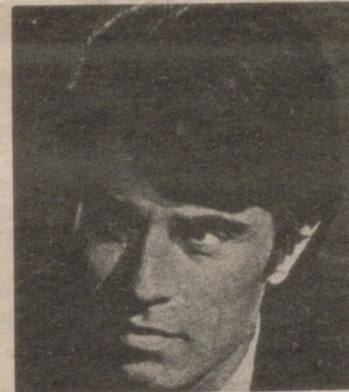
Diganos de una vez qué piensa hacer con Jesús Hermida. Que el pobre no sabe a qué carta quedarse. Si a la del Oso y el Madroño o a la de la Estatua de la Libertad. Por si acaso, cuando alguien estornude, no diga usted: "Jesús", que el del flequillo se lo cree y viene rápido.