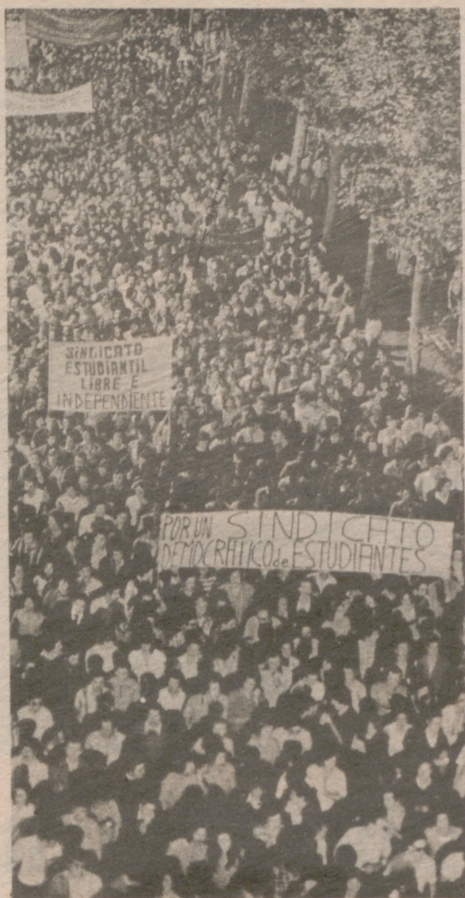
Los manifestantes, a su paso por Calvo Sotelo

Lo cierto es que la manifestación-monstruopartía a las ocho de la tarde de la Plaza de José Antonio con un orden que impresionaba a quienes la presenciaron. A su paso por las principales avenidas de Zaragoza y por la Plaza de Paraíso, millares de zaragozanos que presenciaban la concentración aplaudían con fuerza a los manifestantes, quienes de vez en cuando interrumpían sus "slogans" para exclamar aquello de "El problema es de todos; únete".