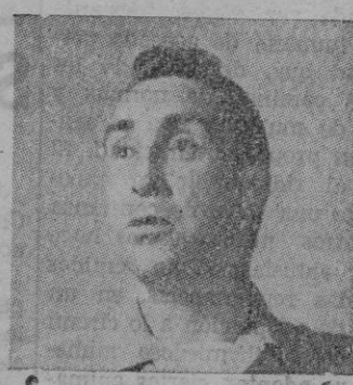
HORACE Mc MAHON

Un hombre justo que comprende los errores del delincuente