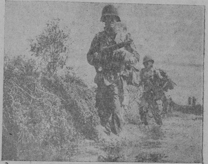
Con barro hasta las rodillas, soldados franceses avanzan por un arrozal en Thai-Binh, donde ausaron muchas bajas a los comunistas