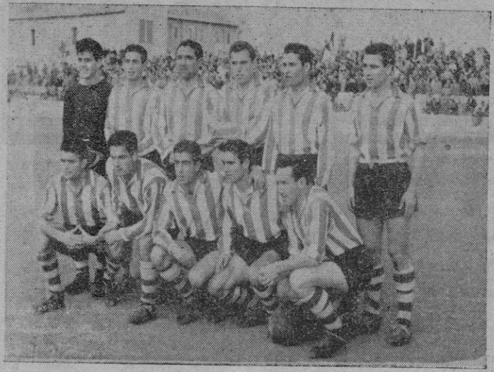
El «Granada» que empató el domingo en Son Canals

Como presumíamos, el Granada dió muestras de ser un buen conjunto, pues con algunos jugadores bien veteranos, pero que