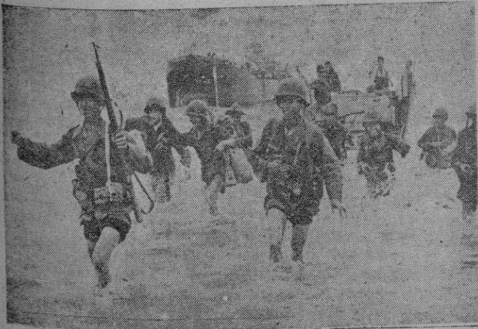
Fuerzas leales indochinas desembarcando en una playa para completar el cerco a una formación comunista