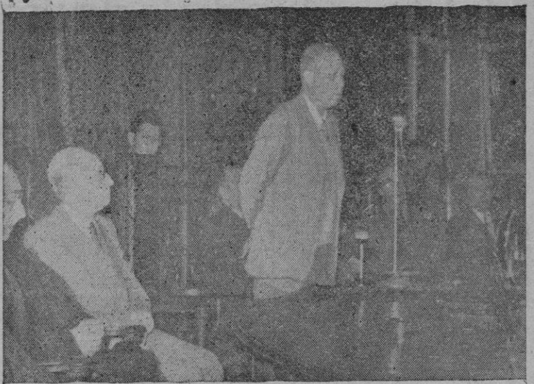
El Duque de Luna, Director General de Turismo, en su discurso a los asambleístas en la sesión de clausura