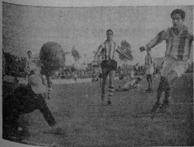
Una jugada de peligro ante la meta granadina