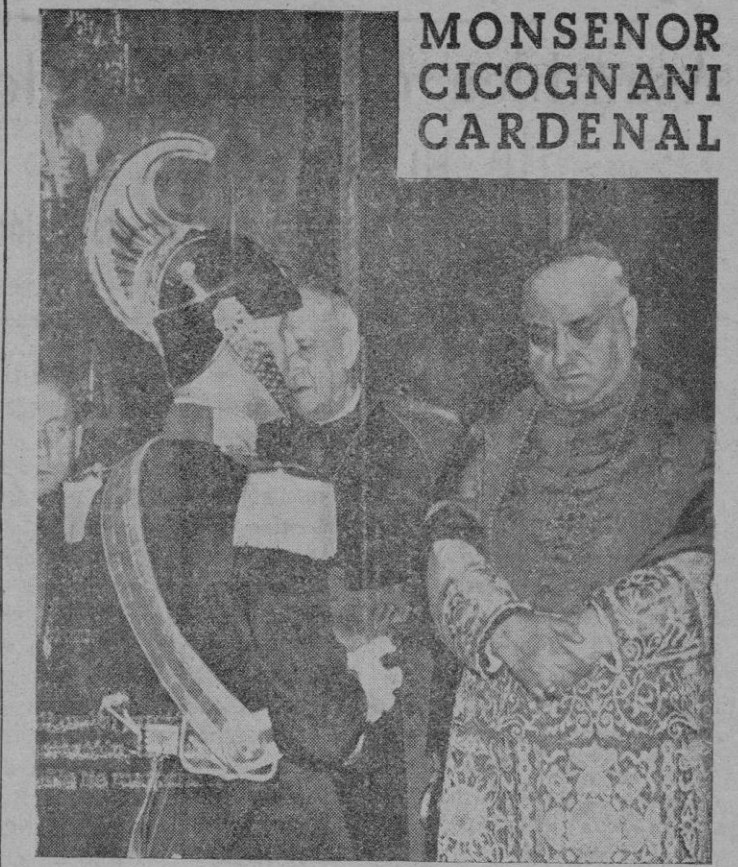
MONSEÑOR CICOGNANI CARDENAL

Taft, que estaba sentado hoy junto a Durkin, le preguntó si se consideraba como «representante del público y no de un determinado grupo». «Así es», respondió Durkin; quien agregó que era partidario de modificar la ley Taft-Hartley, y dijo también que había cortado todos sus contactos con el sindicato de lampistería, del que era su dirigente, limitándose a conservar su calidad de miembro del mismo.—Efe.