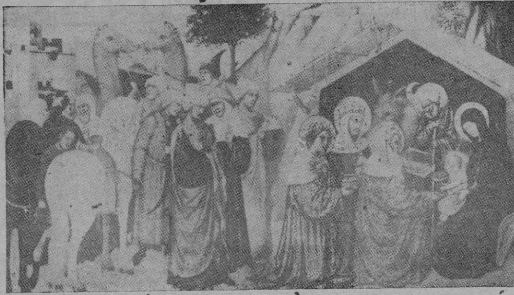
Cuadro del pintor italiano del siglo XIV Andrea Vanni