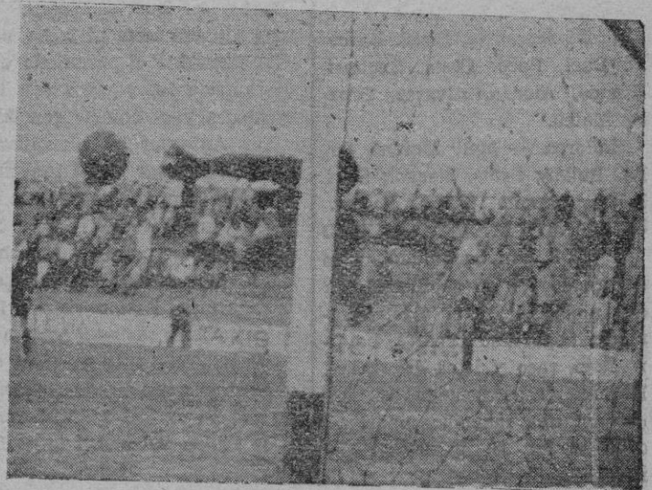
Una de las felices intervenciones de Moll, en el choque de los dos grandes rivales, que el domingo no fué ni mucho menos de la «máxima» emoción

Desde el comienzo de la temporada venimos señalando que el Mallorca no dispone de rematadores, ni tan siquiera regulares chutadores. El fallo del once encarnado es en la línea atacante, en la que además de oportunos y eficaces artilleros, hace falta decisión, codicia, rapidez y sobra por contra, un exceso de prudencia y atolondramiento, que nunca pueden dar buen fruto. La vanguardia mallorquinista, sin jugar bien, llevó de cabeza a la defensa rayada y de ello, ninguno de los atacantes rojos supo aprovecharse. Con decir que contra el marco de Piris se tiraron nueve saques de esquina, muy bien sacados por cierto —hay que de-