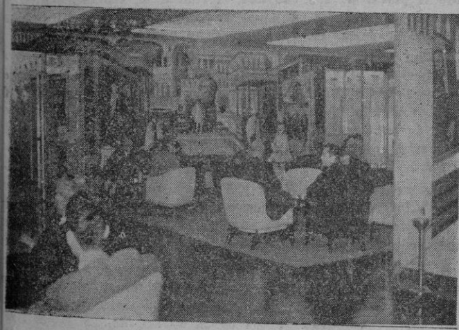
Uno de los salones del «Andrea Doria»

el interior se unen la comodidad a los más sugestivos detalles artísticos: las pinturas murales a base de estilos modernos son muy logradas y ofrecen originales composiciones; todos los detalles están cuidados con minuciosidad para hacer agradable, cómoda y segura la vida a bordo. Cuenta con tres salas de cine y otra al aire libre; tres piscinas sobre cubierta, una de ellas con tobogán; amplísimas cubiertas; una bella capilla, muy capaz y decorada, como el resto de la nave, con arte exquisito; salas de reunión, de juegos y entretenimiento; tres comedores; gimnasio; sala para niños; de lectura, etcétera. El señor Santini, a quien agradecemos las especiales defe-