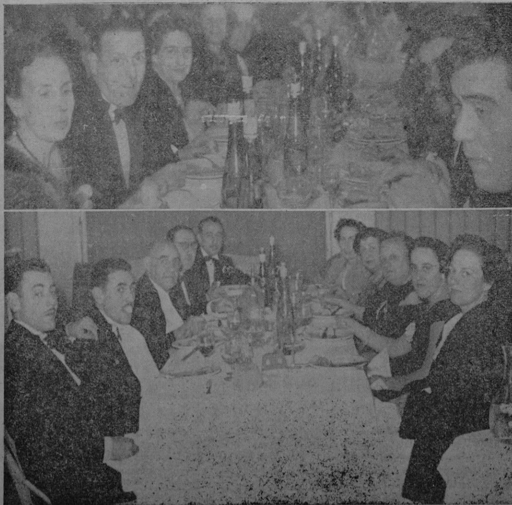
Se recogen en el grabado dos notas gráficas de la celebración de la Noche Vieja en el Círculo Mallorquín y en el Club Náutico, locales en los que reinó la animación propia de la fiesta