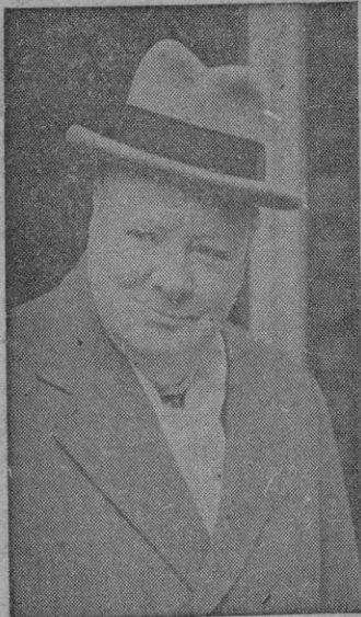
Supuestos planes británicos

Eden, que ya ha conversado con Eisenhower en Nueva York, se espera que informará a Churchill de sus puntos de vista sobre la política norteamericana, especialmente en Extremo Oriente. Se dice que Eden, en su entrevista con Eisenhower, le dió cuenta de que Inglaterra desea poner fin a la guerra de Corea todo lo rápidamente que sea posible y que mientras dura quiere «mantenerla dentro de los más estrictos límites».