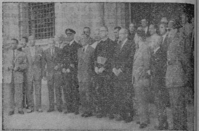
Grupo de asistentes a la misa que el Colegio de Agentes de la Propiedad Inmobiliaria dedicaron a su Santa Patrona y que se celebró en la Basílica de San Francisco