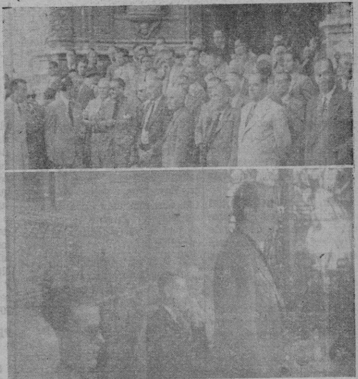
Arriba: los congresistas a la salida de la misa que se celebró en San Francisco. Abajo: el Excmo. Sr. Gobernador Civil dirigiendo la palabra a los asambleístas en la sesión inaugural del Congreso