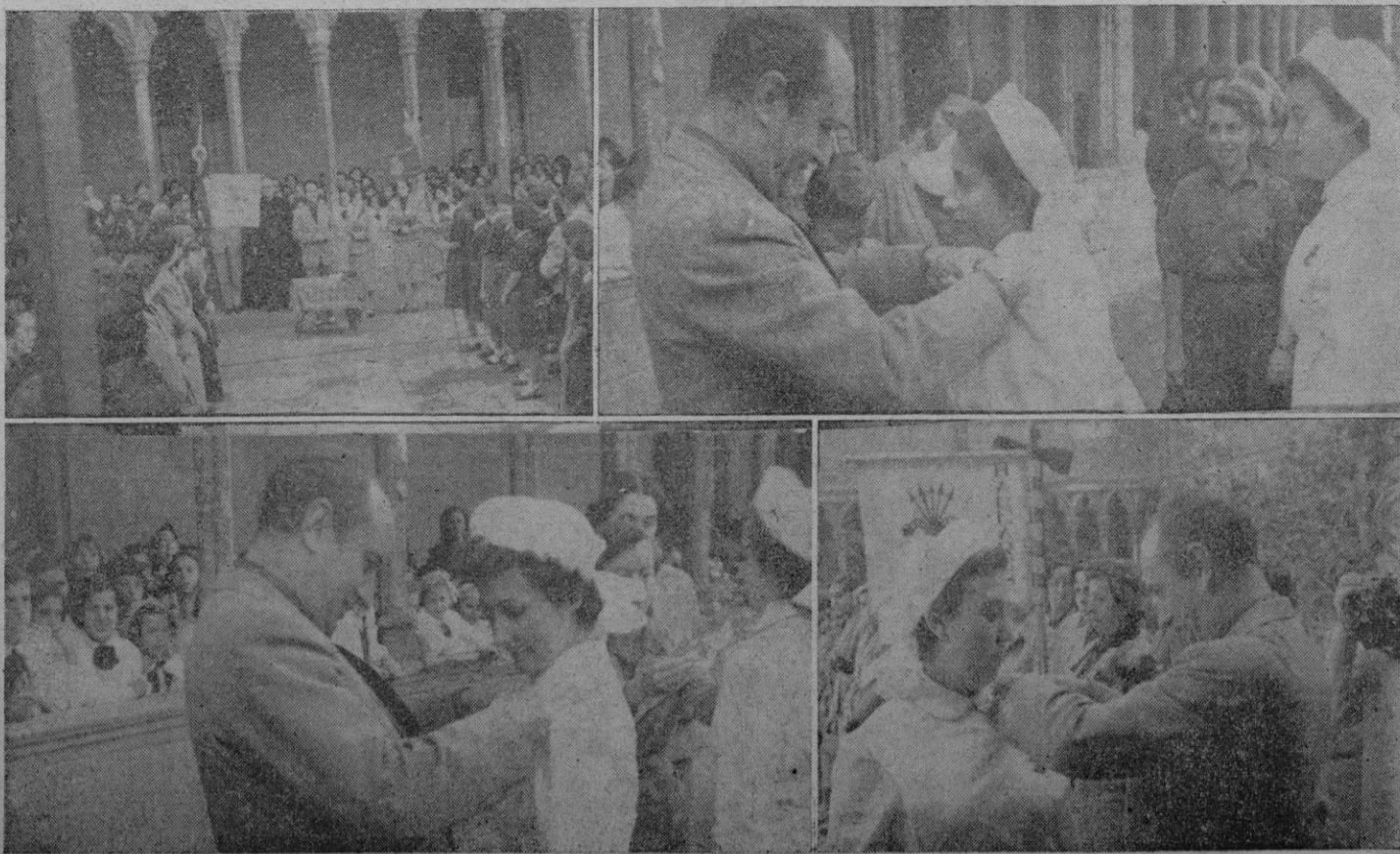
En honor de su celestial patrona organizó lucidos actos la Sección Femenina, cuyas componentes después de oír misa en San Francisco, se reunieron en el patio de aquel convento, donde el Gobernador Civil señor Rodríguez de Valcárcel pronunció una elocuente y patriótica alocución y más tarde impuso las insignias a las nuevas enfermeras, recogiendo en las fotografías diversos momentos de esa ceremonia, que resultó en extremo brillante