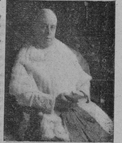
El egregio poeta M. I. don Miguel Costa y Llobera, a cuya memoria se tributa hoy el homenaje que anualmente le dedican sus amigos y admiradores

Aumentará mi nostalgia el hecho de encontrarse en la fiesta