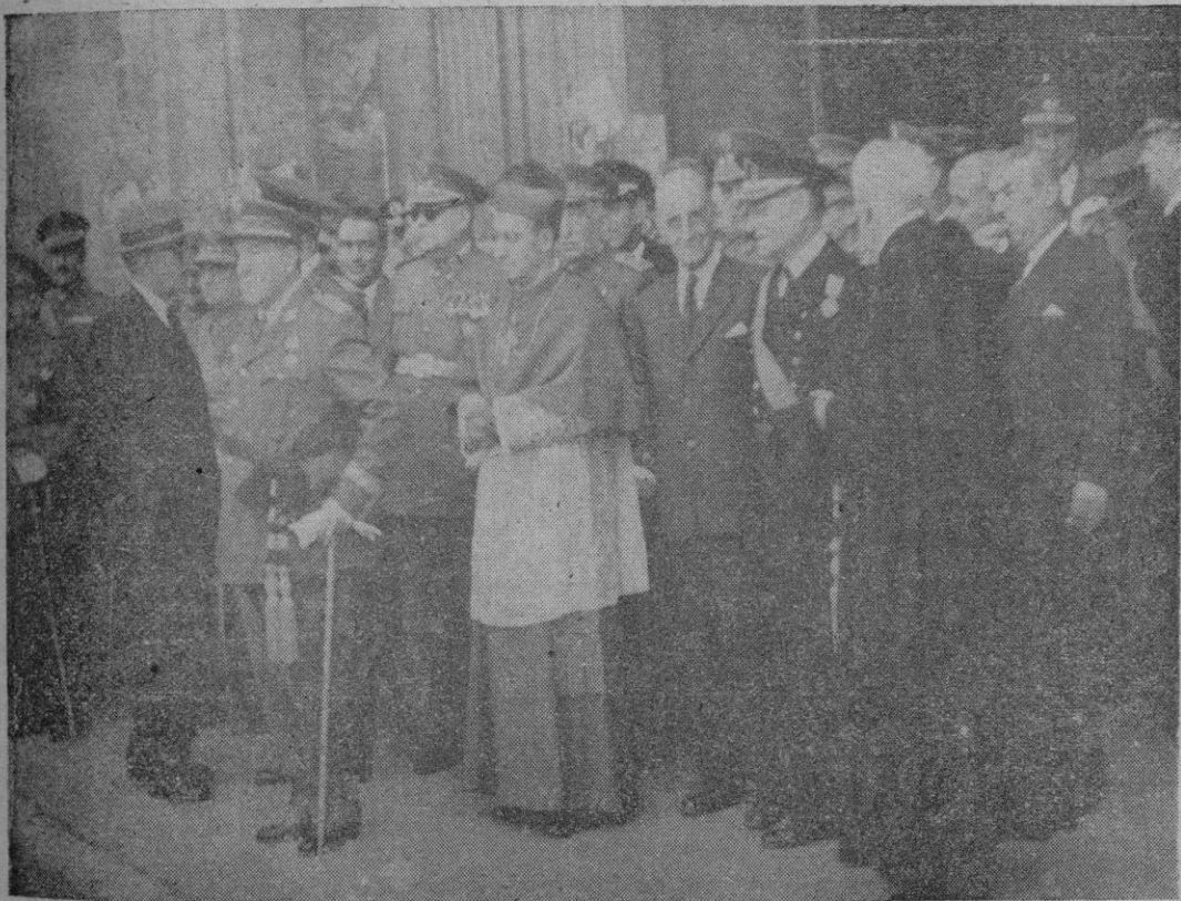
Las autoridades eclesiásticas, castrenses y civiles a la salida de la misa que el cuerpo de Intendencia del Ejército dedicó a su Patrona Santa Teresa de Jesús