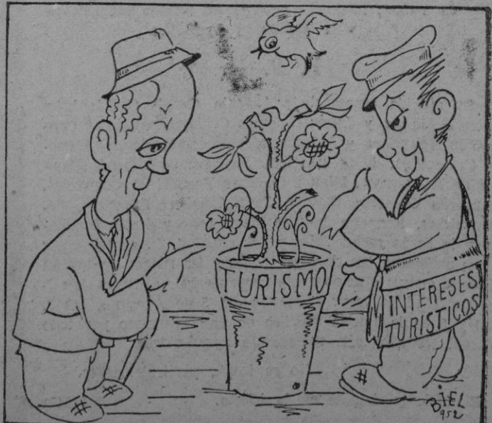
—¡¡Mirá! Parece que estos días ha florecido un poco. —Pues ahora a cuidarlo bien y procura que no se muera.