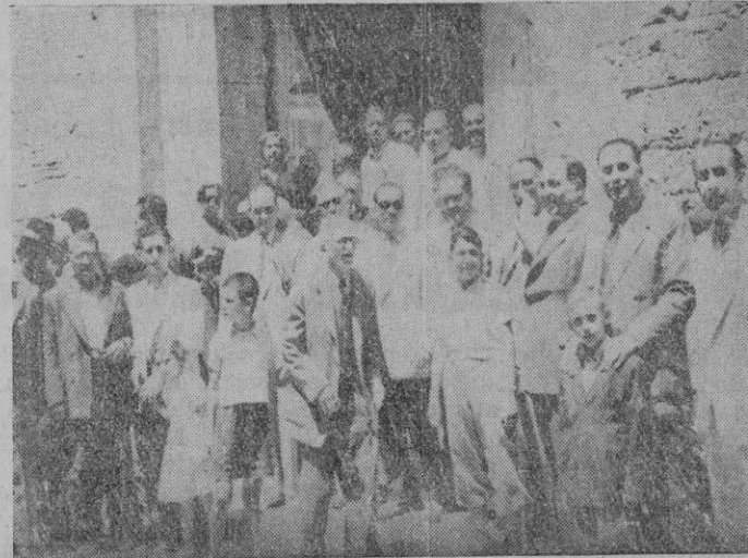
Algunos de los asistentes a la Misa que se rezó en la Iglesia de la Merced y que sufragó el gremio de Panaderos, el cual celebró ayer la fiesta de su Santo Patrón San Marcial