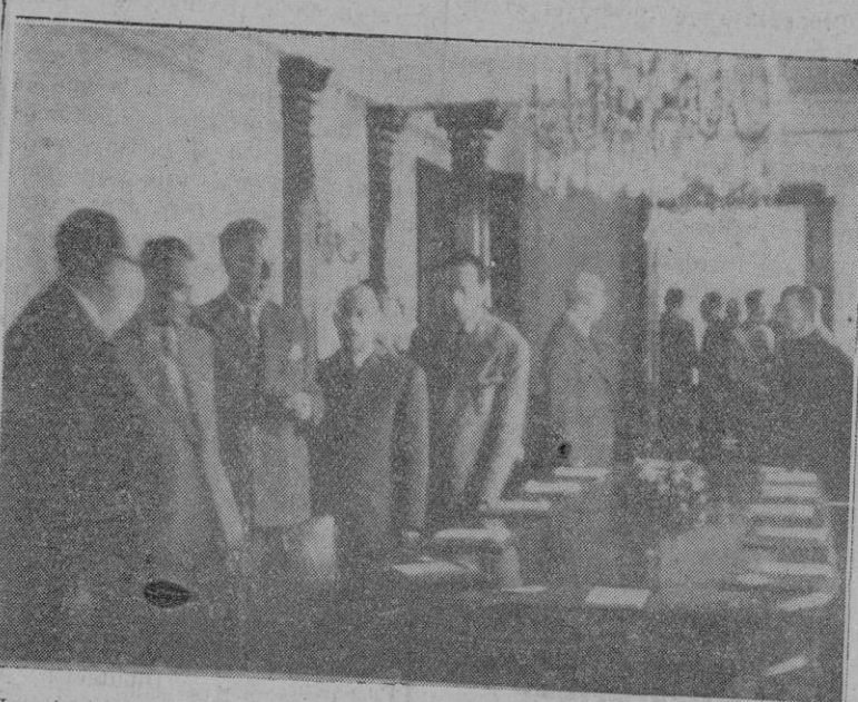
Los invitados en la Sala del Consejo de Mare Nostrum. — Al fondo, la Dirección