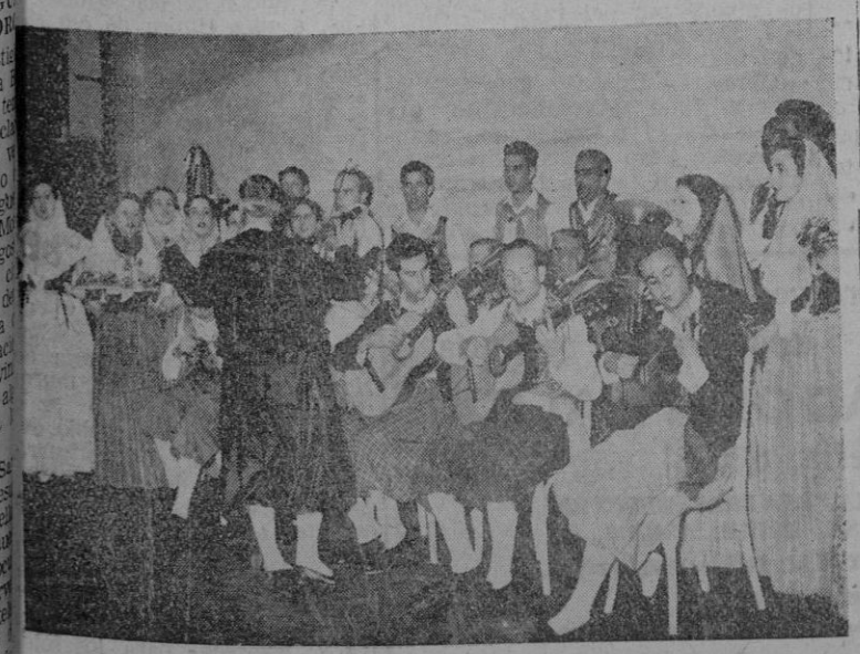
El grupo de Selva durante su actuación en el Casino Municipal de Biarritz en función de gran gala

Biarritz —la elegante playa francesa— ha acogido triunfalmente al grupo "Aires de Montanya" que ha triunfado allí como en todas partes. El Sábado de Gloria la agrupación de Selva actuó en el teatro Principal de aquella ciudad en una brillante función de gala. El día de Pascua por la tarde dió un recital en el estudio Aguilera y por la noche en la Sala de Embajadores del Gran Casino. El éxito fué rotundo. Hubo que reeptir una serie de números.