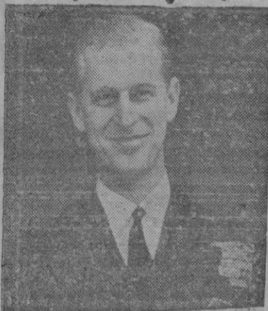
DUQUE DE EDIMBURGO

El marido de la Reina Ana fué solamente nombrado Consejero privado; y Alberto fué sólo "Su Alteza real" hasta que la Reina Victoria, en el año diecisiete de su reinado, lo hizo Príncipe consorte. La Reina Victoria escribió una vez: "Yo