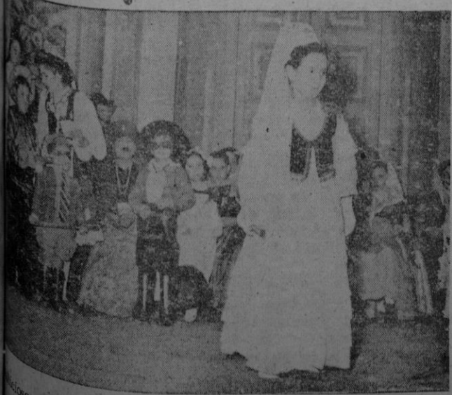
Grupo de pequeños asistentes al festival celebrado el domingo por la tarde en el Teatro Principal.

La tarde de la tarde a cuya hora el Jefe del Estado abandonó el I. N. I. El gentío que había crecido enormemente y que llenaba por completo la Plaza de Salamanca hizo objeto a S. E. de una cariñosa despedida.