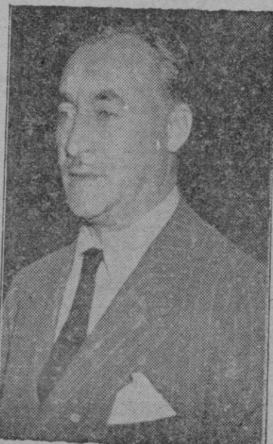
Las preguntas formuladas y las interesantes contestaciones del Duque de Primo de Rivera son las siguientes: