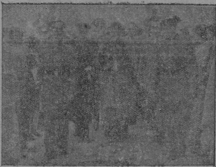
Los Excmos. Ilmos. señor Obispo y señor Gobernador Civil asistiendo al convento de Sancellas para descubrir la placa conmemorativa. (Información en páginas interiores)