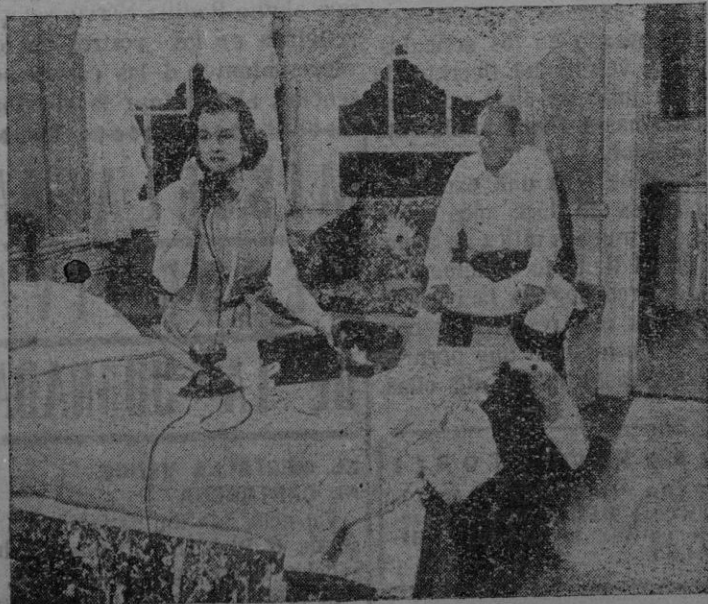
UNA PELICULA QUE REPRODUCE ESCENAS VIVIDAS EN TODOS LOS HOGARES

HOY. - Grandioso éxito del indiscutible mejor programa semanal STEPHEN Mc NALLY - ALEXIS SMITH