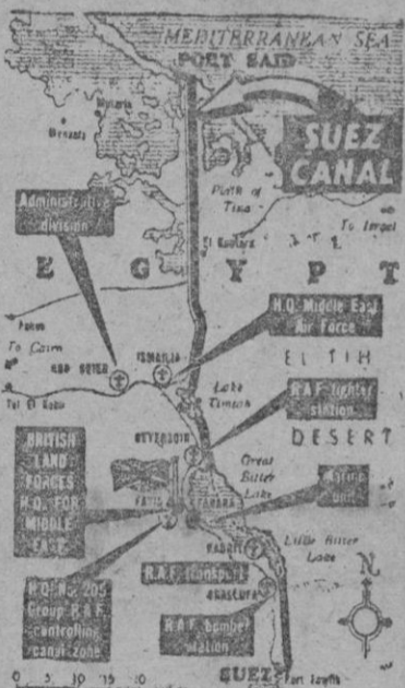
Gráfico de la zona donde se desarrollan los acontecimientos que constituyen un nuevo motivo de inquietud internacional