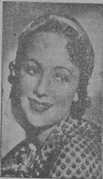
OLIVIA DE HAVILLAND

Si la labor de los actores y guionista son excelentes la de su director Victor Fleming resulta más superable consiguiendo, al lograr para el Séptimo Arte, amplios horizontes con el término "filmico" de la obra origina de recia contextura y justeza dramática, imponiendo una técnica que