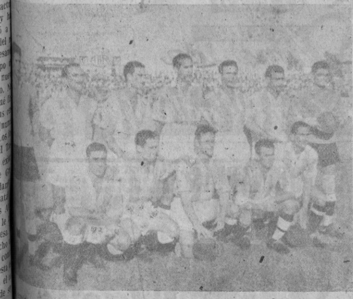
El Atlético Baleares que anteyer debutó en Segunda División, venciendo al Levante de Valencia

Madrid, 10.—Se ha celebrado en Vichy un Congreso Internacional de Importadores y Exportadores de todos los países, al que han asistido en nombre de España, el Presidente y el Vicepresidente de la Asociación de Importadores y Exportadores de Madrid, acompañados del Secretario General de la citada entidad.—Cifra.