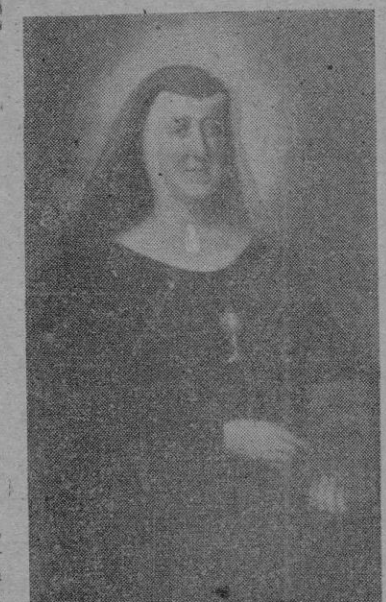
aquellas jóvenes necesitadas de protección y moral elevación.

Maestro bueno que vive en el Sagrario, debe ser acicate fuerte para un apostolado social, ejercido sobre un espíritu evangélico, sobre