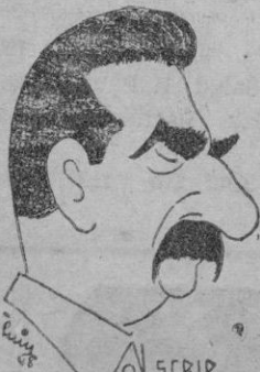
Stalin, que ha fracasado al tratar de atraerse a Turquía

Gran Bretaña se ha adherido ya a la tesis estadounidense y es de esperar que Francia hará lo mismo. No será por tanto extraño que en los próximos días Stalin ordene que se inicie una fuerte ofensiva propagandística, contra estos hechos, cuyas consecuencias son graves para el Kremlin: porque desde el bastión turco se dominan los territorios del Oriente Medio y del sudeste de Europa, donde como es sabido existen valiosos yacimientos petrolíferos.