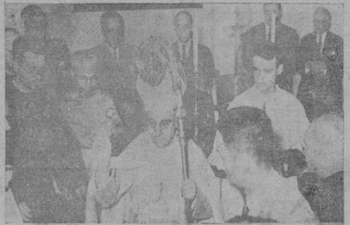
El Excmo. y Rdmto. señor Obispo procede a la bendición de la Sala de Conferencias, primera de las dependencias terminadas de la reconstruida Universidad Luliana. (Información en páginas interiores)