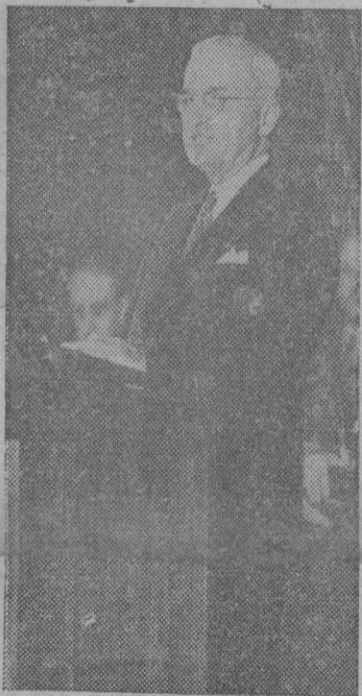
Luchásteis bien y sin retroceder. Vosotros no esclavizásteis a ningún

Dirigiéndose a los combatientes de la ONU en los momentos actuales, Truman dijo: "Hombres de más o menos fuerzas armadas en Corea, participareis a la historia como el primer ejército que combatió bajo la bandera de una organización mundial en defensa de la libertad humana.