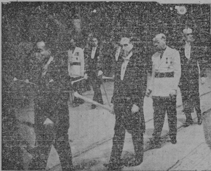
La Corporación Municipal en una de las presidencias de la procesion del Jueves Santo