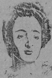
Victoria de los Angeles

Nueva York, 19. — El "New York Times" hace una elogiosa crítica de la soprano española María Victoria de los Angeles, que ha aparecido en la Opera Metropolitana de esta ciudad interpretando el papel de Margarita en la ópera "Fausto".