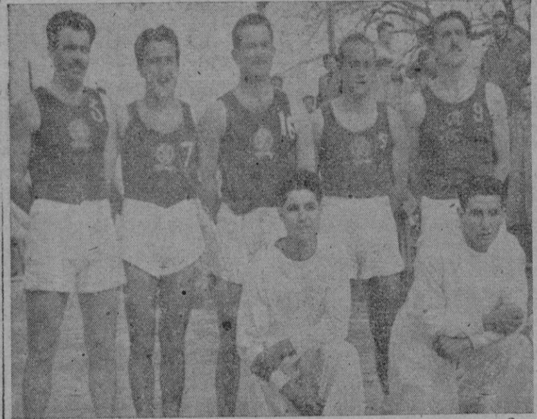
El equipo campeón balear, C. D. Hispania, clasificado brillante subcampeón en el torneo Copa Federación Española de Baloncesto

En parte, quizá en gran parte, Bunche tiene razón. Porque gracias a las Naciones Unidas bien capitaneadas y dirigidas por los Estados Unidos, Rusia se encuentra ahora con un problema en Asia, a consecuencia de que sus cálculos sobre Corea le han salido mal. Su más poderoso satélite, la China comunista, ha quedado neutralizada, fuera de la O.N.U., sin forma, calificada de agresora y con sus mejores ejércitos aniquilados. Ahí está pues el hecho de que los chinos han servido al juego ruso en Corea, sin obtener ventaja alguna y resulta claro que los rusos se muestran en extremo reacios a fortalecer a los comunistas chinos con mucha aviación y material pesado que, a la larga, podrían convertirlos en los amos de Asia. Si las fuerzas de la ONU se hubieran retirado, o se retirasen, la URSS habría obtenido una fantástica victoria a ningún precio. A Mao-Tse-Tung no le queda más remedio ahora que admitir su fracaso o una tentativa de aplastar la superioridad de fuego de las fuerzas de las Naciones Unidas por medio de una verdadera y sangrienta hecatombe, ya que sólo en las seis semanas escasas de duración que lleva la "operación Killer" del general Ridgway, los chinos han tenido 171.000 bajas.