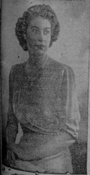
La Princesa Isabel de Inglaterra llegó a Malta en avión para visitar a su esposo el Duque de Edimburgo.

Se cree en los círculos autorizados de Londres que hasta tanto no se reciba el segundo informe, el asunto no pasará a su oportuno estudio por parte del Gabinete británico.