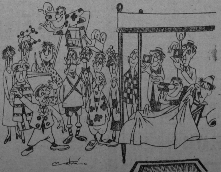
El despertar de un aristócrata un día de llegada de un buque con turistas