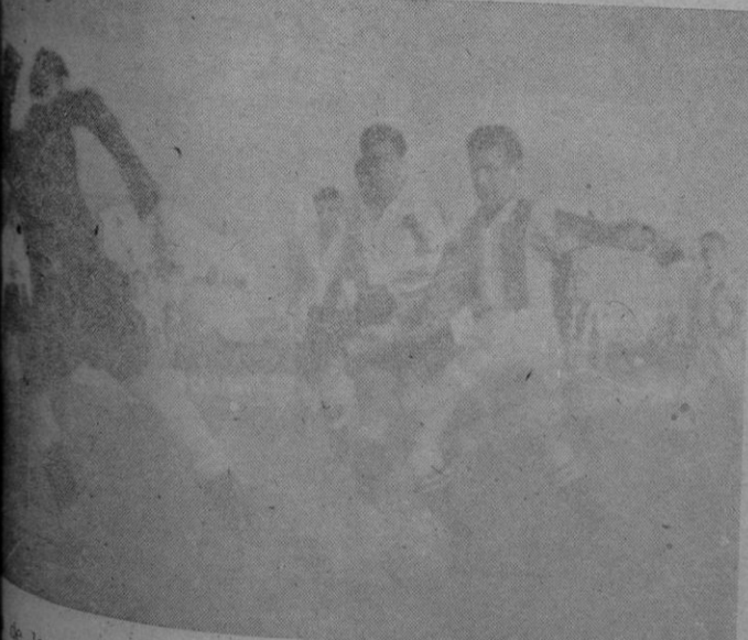
De los muchos barullos que se produjeron el domingo, ante la del Imperial, la que batió seis veces, la muchachada de Son Canals

Realizar la contienda, el martes de clase y potencialidad de los conjuntos contendientes durante el partido. El 6-1 favorable a los palmesanos superaron en todo totalidad, individual, por los locales, jugando casi tonos destacados Pueyo —la del encuentro—, Miguelin