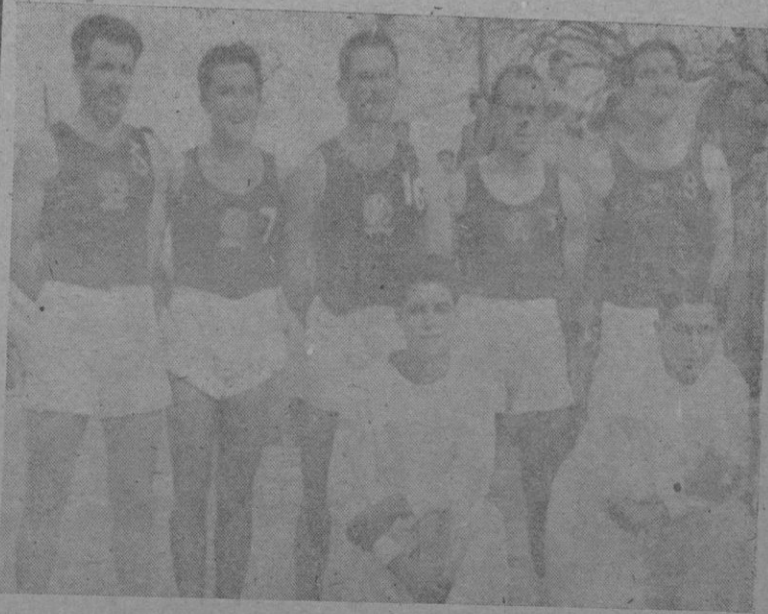
El equipo del C. D. Hispania, gran vencedor del campeón valenciano, tras cuyo triunfo pasa a disputar los cuartos de final del Campeonato de España