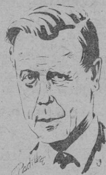
Duque de Windsor

Nueva York, 29. — "The Journal American" dice hoy que los duques de Windsor están negociando su intervención por la radio y televisión. La primera oferta que les ha sido hecha les supondría un beneficio de 350.000 dólares. Otro oferta hecha por la National Broadcasting Corporation se calcula en unos 250.000 dólares.