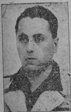
Conde de Olocau

Madrid, 1. -- En la última reunión celebrada por la Comisión Directiva de la Delegación Nacional de Deportes, entre otros se tomaron los siguientes acuerdos: