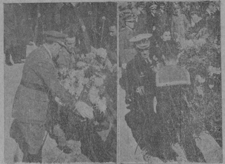
Los Excmos. Sres. Capitan General y Comandante General de la Base Naval depositando coronas en la Cruz de los Caídos.