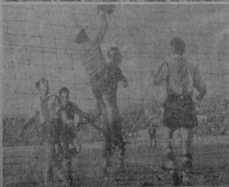
El equipo del "Hércules" que causó magnífica impresión. — Abajo el primer tanto conseguido por el Mallorca