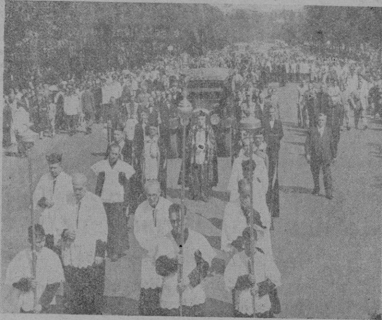
Un aspecto de la comitiva íubre a su paso por la Castellana

Serán recibidos por el Circolo Canktier de Roma y por las autoridades españolas e italianas. — Efe.