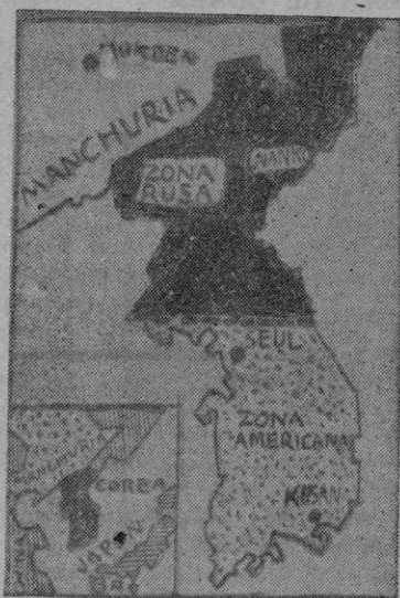
En Corea las cosas están por resolver

El primer choque entre las unidades norteamericanas -- aerotransportadas en gran parte -- con las columnas corazadas de Corea del Norte ha tenido un resultado adverso para las primeras. Mac Arthur no ha tenido tiempo de situar en la península los contingentes de hombres y, sobre todo, de armas y material que podrían ser una garantía de acción inmediata efectiva. El frente surcoreano no ha conseguido todavía la consistencia necesaria y esta elasticidad de movimientos de ahora se debe a lo primeramente señalado a más del tiempo que se empeña en favorecer a los invasores. Siguen faltando carros, cañones, antitanques, etc., en tierra, que es donde ha de resolverse la situación desfavorable de ahora. En el Norte los rusos han armado un poderoso ejército, que es el que hoy avanza y progresa, valiéndose del fabuloso "stock" de las razas de la URSS. Por eso, Mac Arthur, que está en el ajo de todo y valga la palabreja, reclamó el urgente empleo de la infantería con sus modernas armas de acompañamiento. Porque de la aviación a la infantería va lo que va de hilvanar a coser. Los norteamericanos, y valga también el símil, están todavía hilvanando en Corea del Sur; los rojos han ido, y siguen, cosiendo. Por eso la actuación y los resultados de estos últimos, parecen y son más firmes y efectivos.