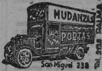
San Miguel 238

fabricantes de este manufac- turado, deberán comunicar mensualmente a la Jefatura Nacional del Servicio de Car- nes Cueros y Derivados, la cantidad de lana lavada, sucia o peinada, o de hilo, que reciban cada mes, hasta la total resolución de los cupos de bidos, haciendo uso para ello del documento reglamentario CCD-244 bis, establecido al efecto para la campaña ante- rior que ahora se liquida