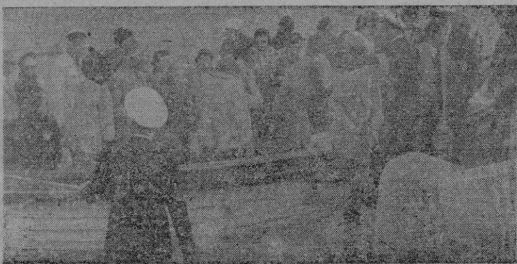
Un grupo de turistas norteamericanos que viajan a bordo del "Britannic" en el momento de desembarcar en Palma, cuyos alrededores recorrieron el domingo por la mañana.