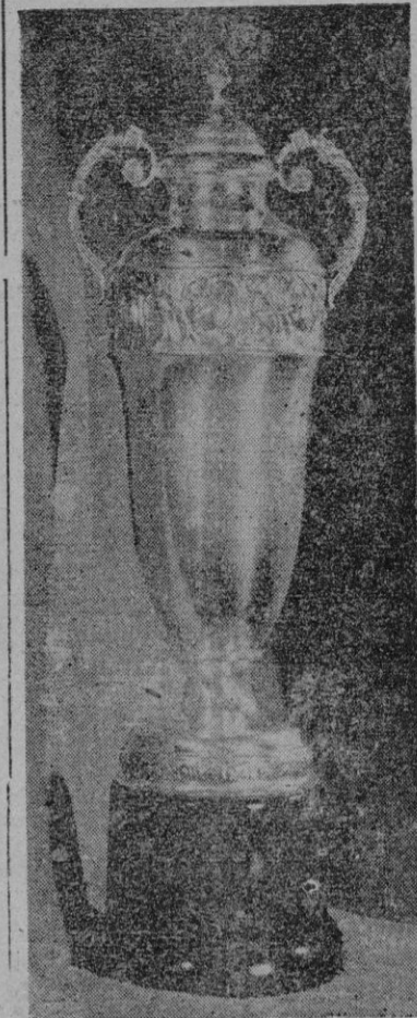
El Trofeo Sáenz de Buruaga, cuya disputa empieza hoy en la piscina del C. N. Palma

Esta mañana tendrá lugar la primera de las tres jornadas deportivas en las que se ha de disputar el "Trofeo Sáenz de Buruaga" donado a tal efecto por el entusiasta